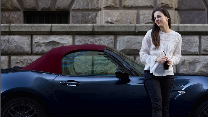
MX-5 ST 2.0L Skyactiv-G 184ch BVM Sélection avec option toit souple rouge (12) et peinture Deep Crystal Blue