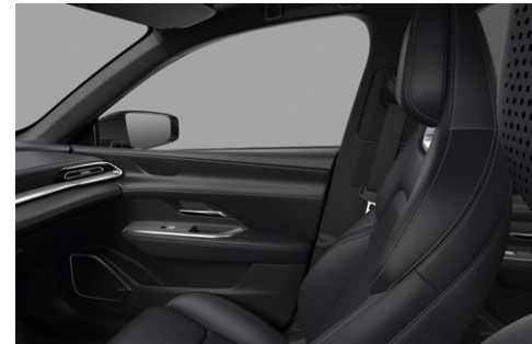
Kunstlæder i sort