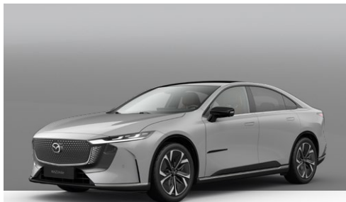
AERO GREY | Kr. 10.000,-