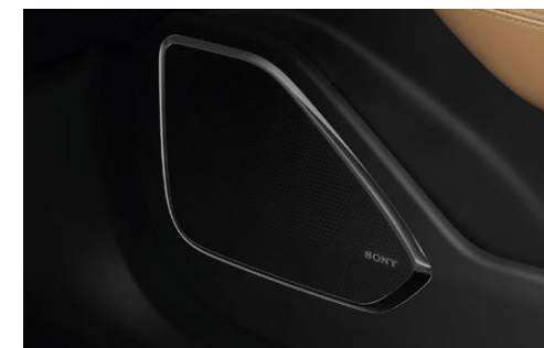
Sony™ Audio System med 14 højttalere