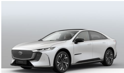
CRYSTAL WHITE PEARL | uden merpris