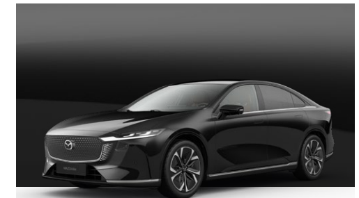
JET BLACK | Kr. 10.000,-

Brug vores bilkonfigurator til at finde den perfekte MAZDA6e til dig.