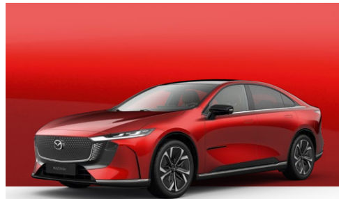
SOUL RED CRYSTAL | Kr. 12.000,-