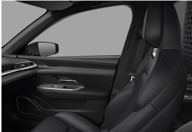
Takumi: Sæder med kunstlæder i sort. Loftsbeklædning i sort