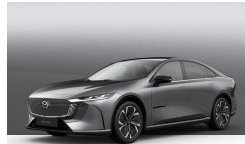
MACHINE GREY | Kr. 11.000,-