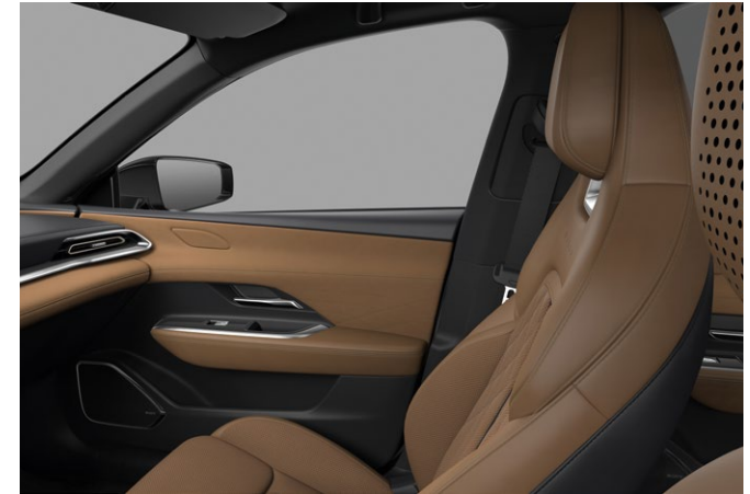
Takumi Plus: Sæder med brunt Nappa-læder og ruskindslignende stof. Loftsbeklædning i sort