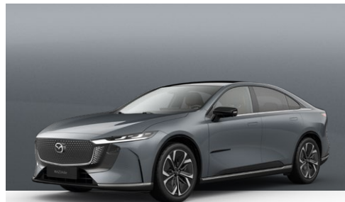
POLYMETAL GREY | Kr. 10.000,-