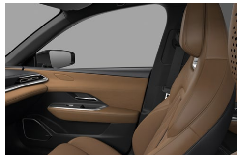
Sæder med brunt Nappa-læder og ruskindslignende stof