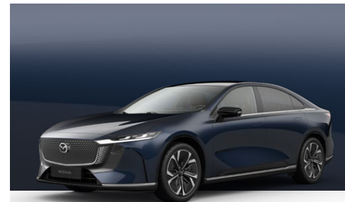
DEEP CRYSTAL BLUE | Kr. 10.000,-