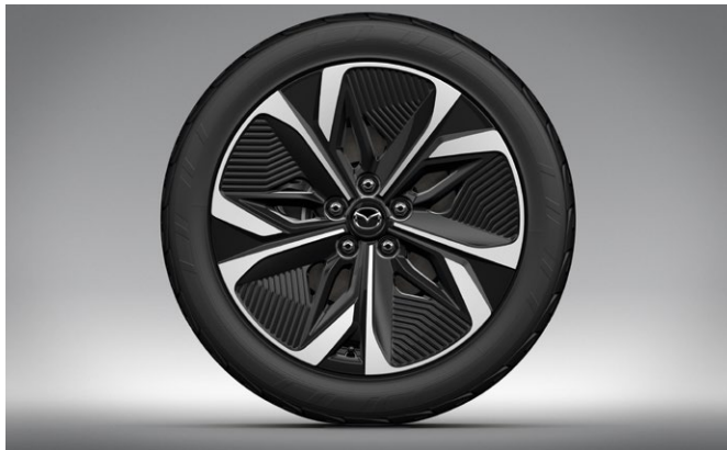
Aerodynamiske 19" aluminiumsfælg med dæk i dimensionen 245/45R19 (Michelin)