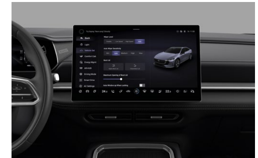
14.6" berøringfølsom farveskærm