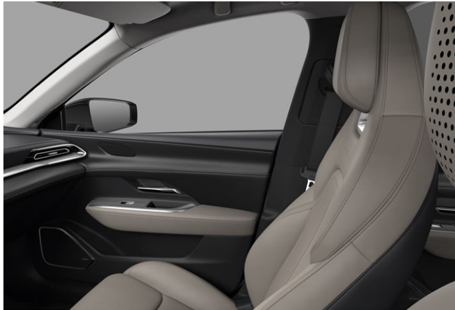
Takumi: Sæder med kunstlæder i "Warm Beige". Loftsbeklædning i lys grå