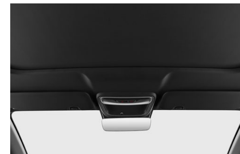
Elektrisk solafskærmning til panoramataget