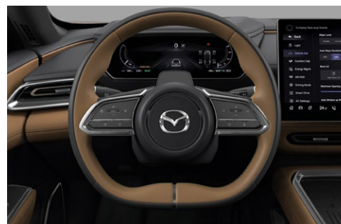
Rat beklædt med 2-tonet læder