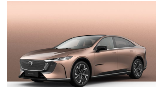
MELTING COPPER | Kr. 10.000,-