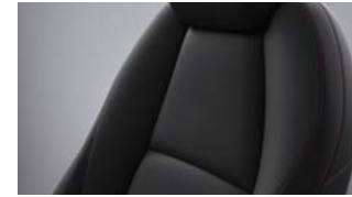
Sort stof med røde syninger til Mazda3 Homura.