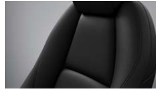
Sort læder til Mazda3 Takumi