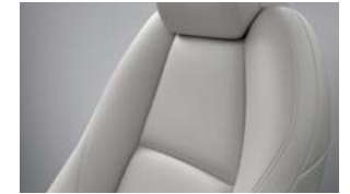
Hvidt læder til Mazda3 Sedan Takumi med e-Skyactiv X-motor