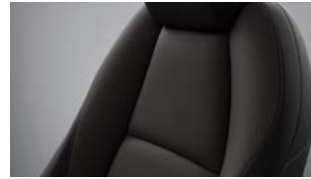
Sort stof til Mazda3 Prime-Line, Centre-Line og Exclusive-Line