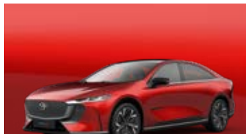
SOUL RED CRYSTAL | CHF 1'400.-