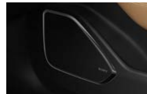
Audiosystem mit DAB+ und 14 Sony™-Lautsprechern