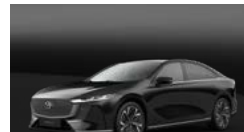
JET BLACK | CHF 900.-

Finden Sie mit dem Konfigurator Ihren perfekten brandneuen Mazda6e