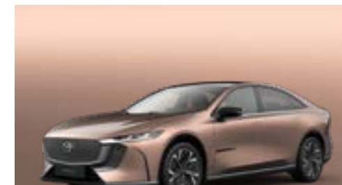
MELTING COPPER | CHF 900.-