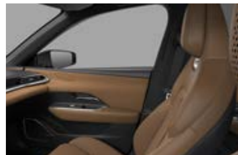
Nappaledersitze in «Tan», in Wildlederoptik