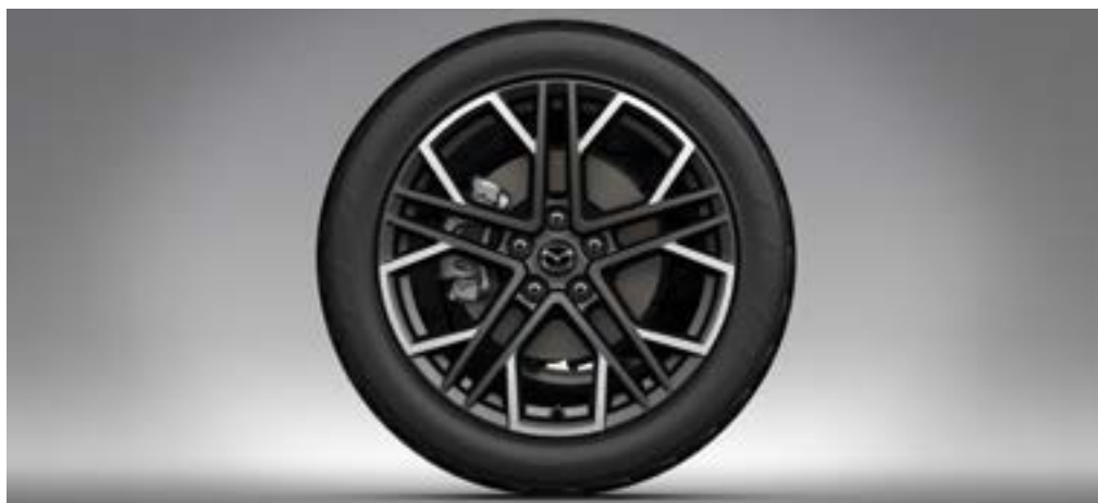
19"-LEICHTMETALLFELGE DESIGN 77A, ANTHRACITE POLIERT, GLÄNZEND, DIAMANTSCHLIFF CHF 468.-