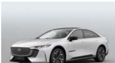
CRYSTAL WHITE PEARL | CHF 0.-