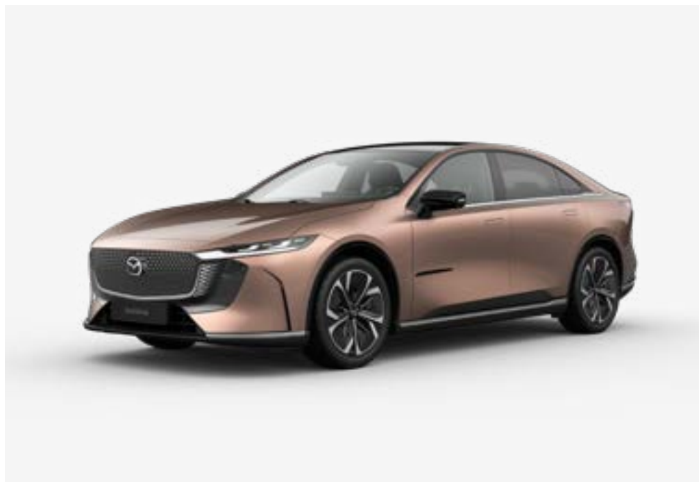
Der brandneue Mazda6e Takumi in Melting Copper