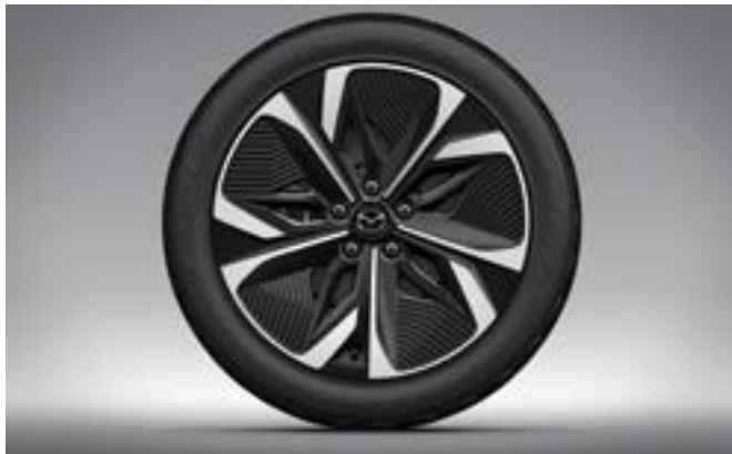
Aerodynamische 19"-Leichtmetallfelgen in "Black Silver Metallic" mit 245/45 R19-Reifen