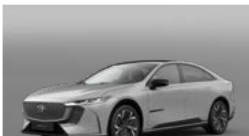
AERO GREY | CHF 900.-