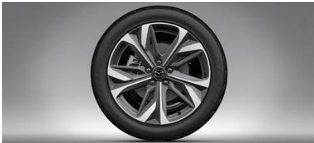
19"-LEICHTMETALLFELGE DESIGN 180 CHF 433.-