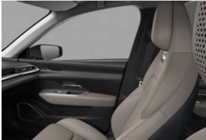
Sitzbezüge aus Simillieder in «Warm Beige» - TAKUMI