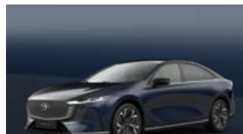
DEEP CRYSTAL BLUE | CHF 900.-