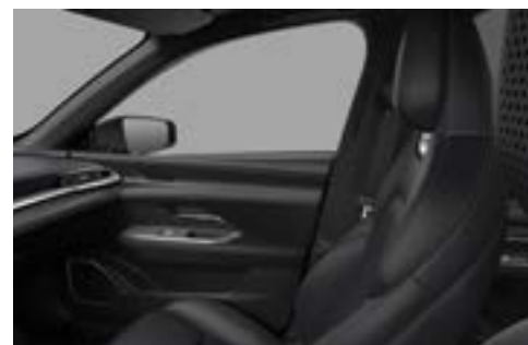
Sitzbezüge aus Similileder in «Sporty Black»