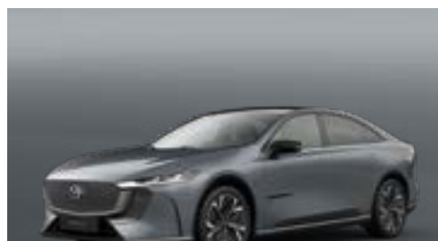
POLYMETAL GREY | CHF 900.-