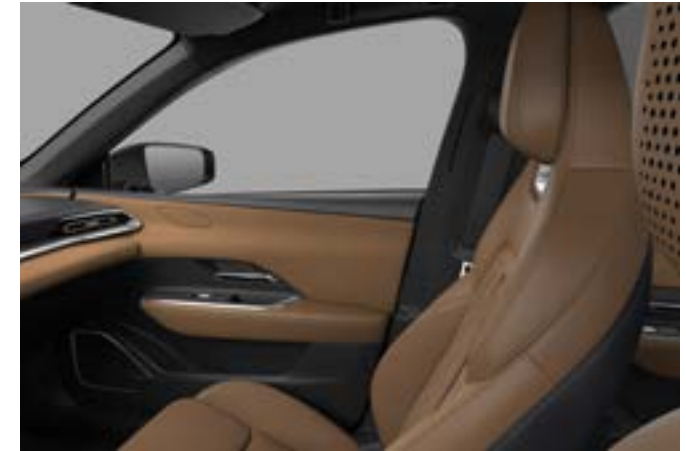
Nappaledersitzen in "Tan" und Wildlederimitat - TAKUMI PLUS