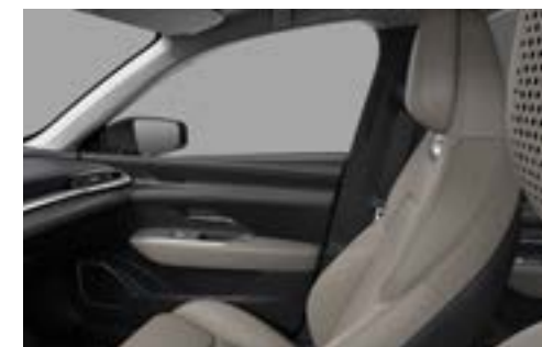
Sitzbezüge aus Similileder in «Warm Beige»