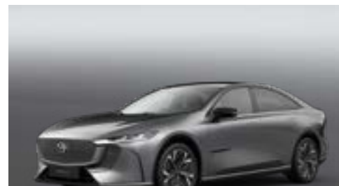
MACHINE GREY | CHF 1'200.-