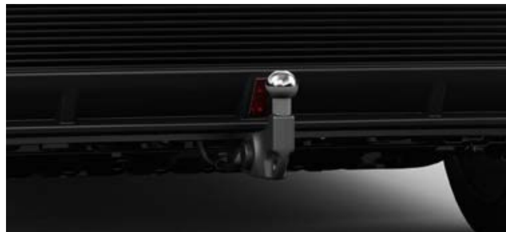
VERSENBARE ANHÄNGERKUPPLUNG, VOLL ELEKTRISCH, EINSCHLIESSLICH GURT CHF 2'420.-

Optionen und Zubehör: In dieser Preis- und Spezifikationsübersicht finden Sie eine kleine Auswahl unserer Zubehörreihe. Weitere Informationen zur gesamten erhältlichen Zubehörpalette finden Sie unter https://de.mazda.ch/konfigurator/ , wählen Sie das Fahrzeug aus und besuchen Sie den Abschnitt «Optionen und Zubehör». Die unverbindlichen Preisempfehlungen von Mazda (Suisse) SA unterliegen Änderungen und berücksichtigen möglicherweise Extras wie die Lackierung nicht. Im Preis der Leichtmetallfelgen sind die Reifen nicht enthalten. Die Kosten für den Einbau von Zubehörteilen können von Mazda-Händler zu Mazda-Händler unterschiedlich sein. Weitere Informationen zum Originalzubehör von Mazda und die aktuellen Preise, einschliesslich der unterschiedlichen Einbaukosten erhalten Sie von Ihrem Mazda-Händler