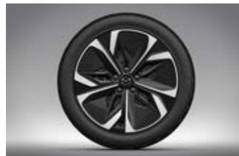
Aerodynamische 19"- Leichtmetallfelgen in «Black Silver Metallic» mit 245/45 R19-Reifen