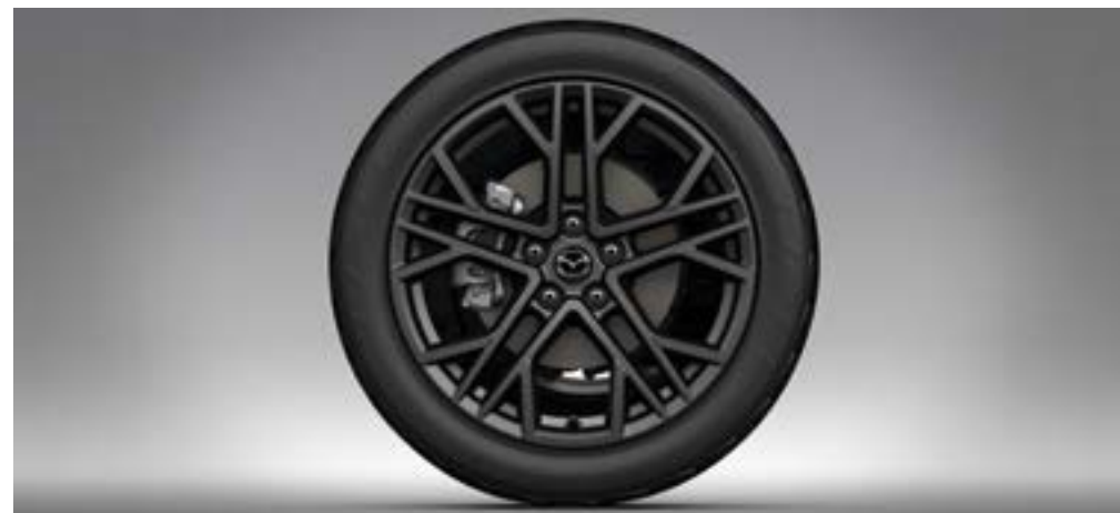
19"-LEICHTMETALLFELGE DESIGN 77, ANTHRACITE, GLÄNZEND CHF 433.-