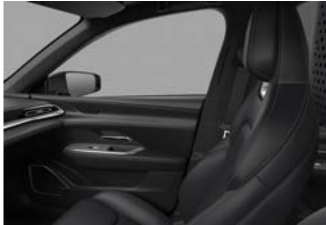
Sitzbezüge aus Simillieder in «Sporty Black» - TAKUMI