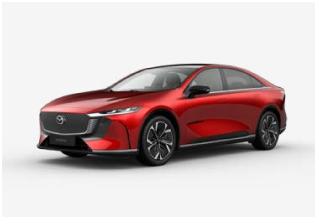
Der brandneue Mazda6e Takumi Plus in Soul Red Crystal