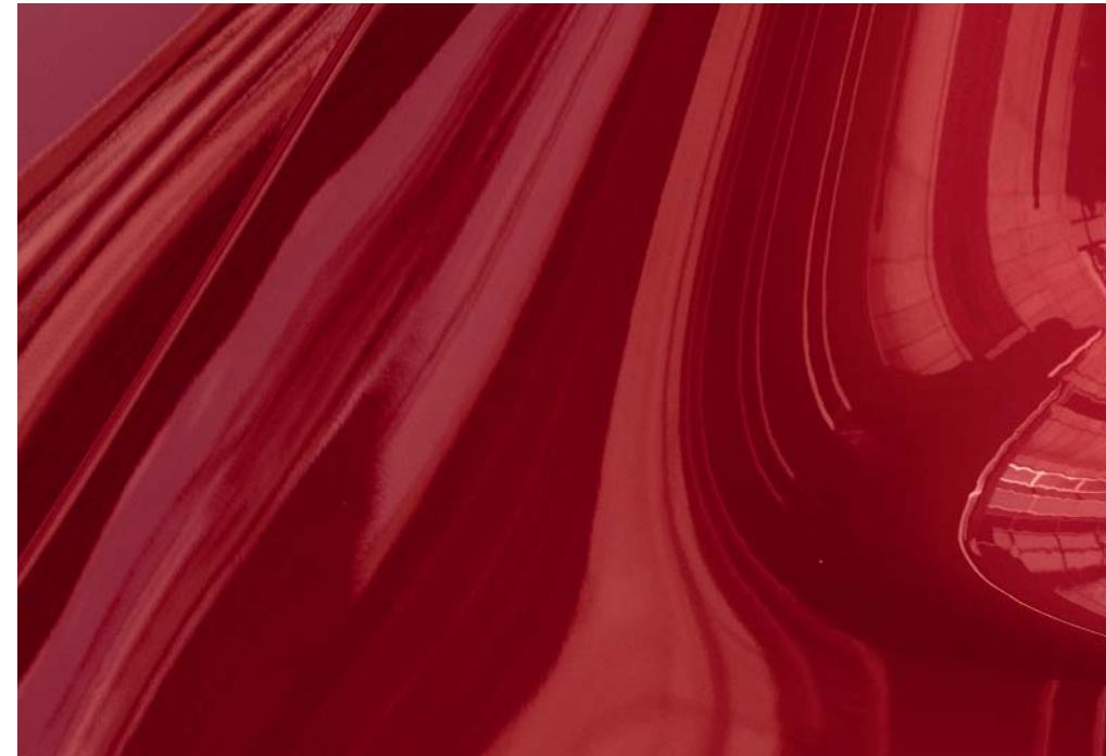
Soul Red Crystal Metallic