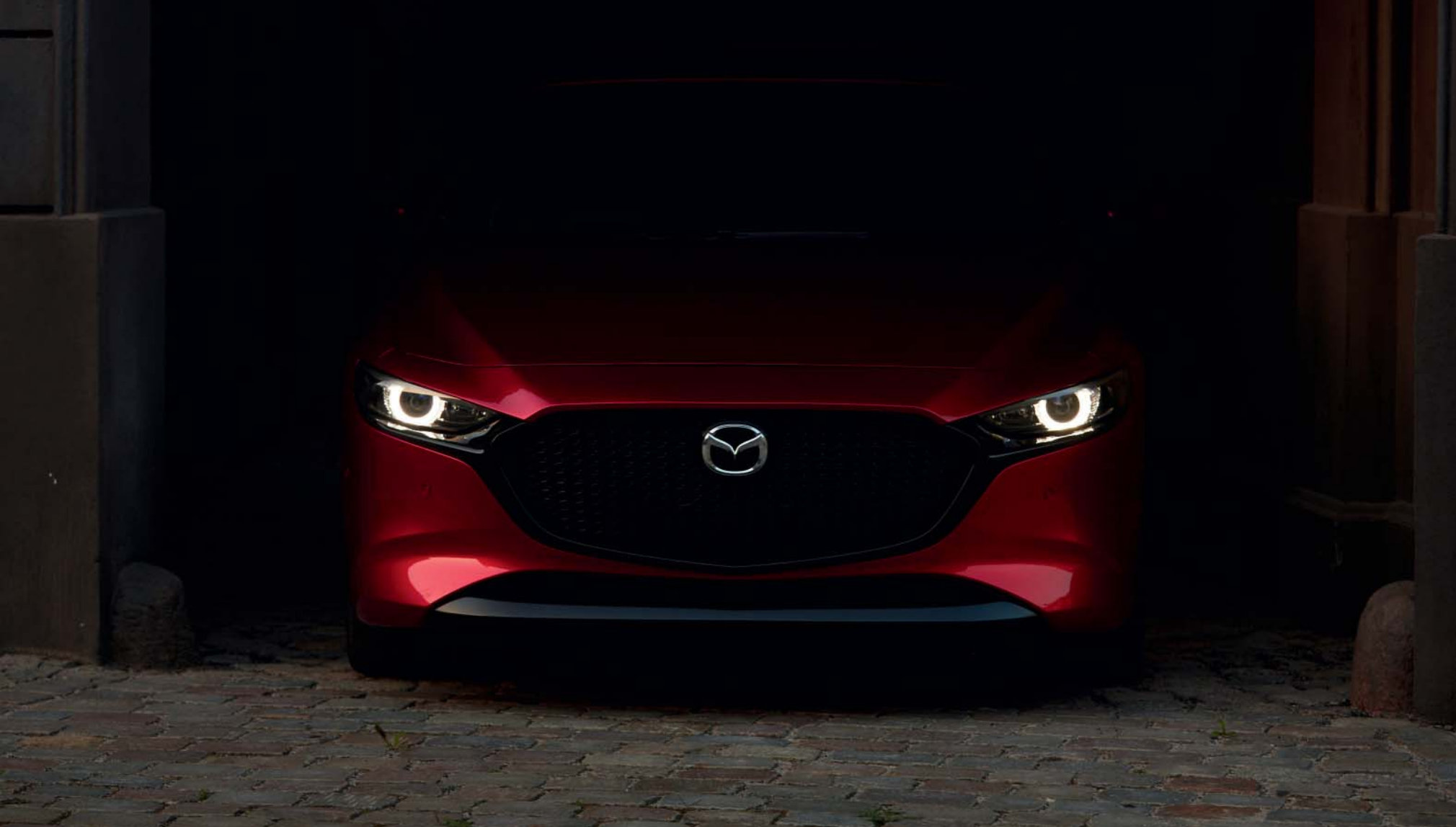
Bilden visar en Mazda3 Cosmo Hatchback