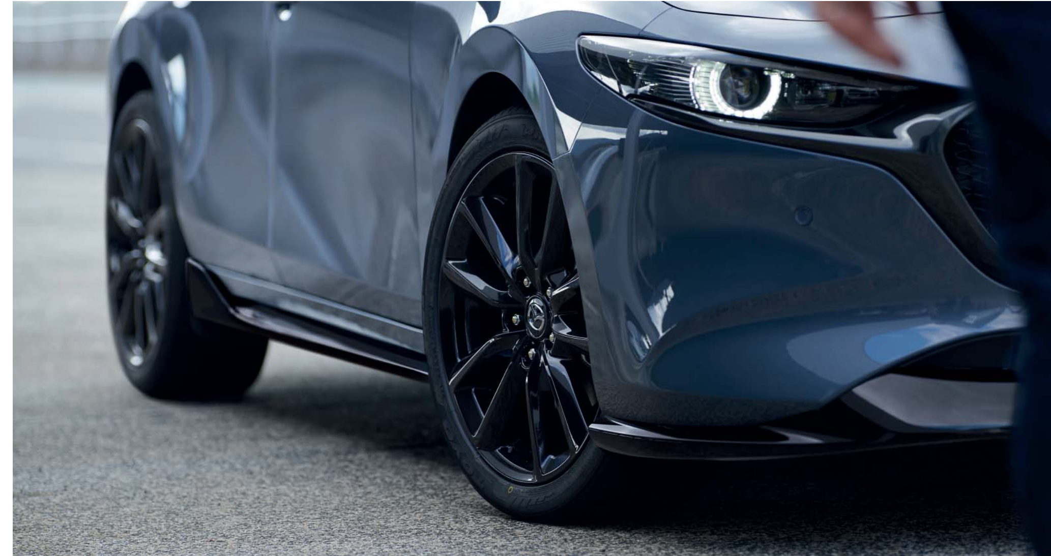
Svartlackerat bodykit och svarta tillbehörsfälgar