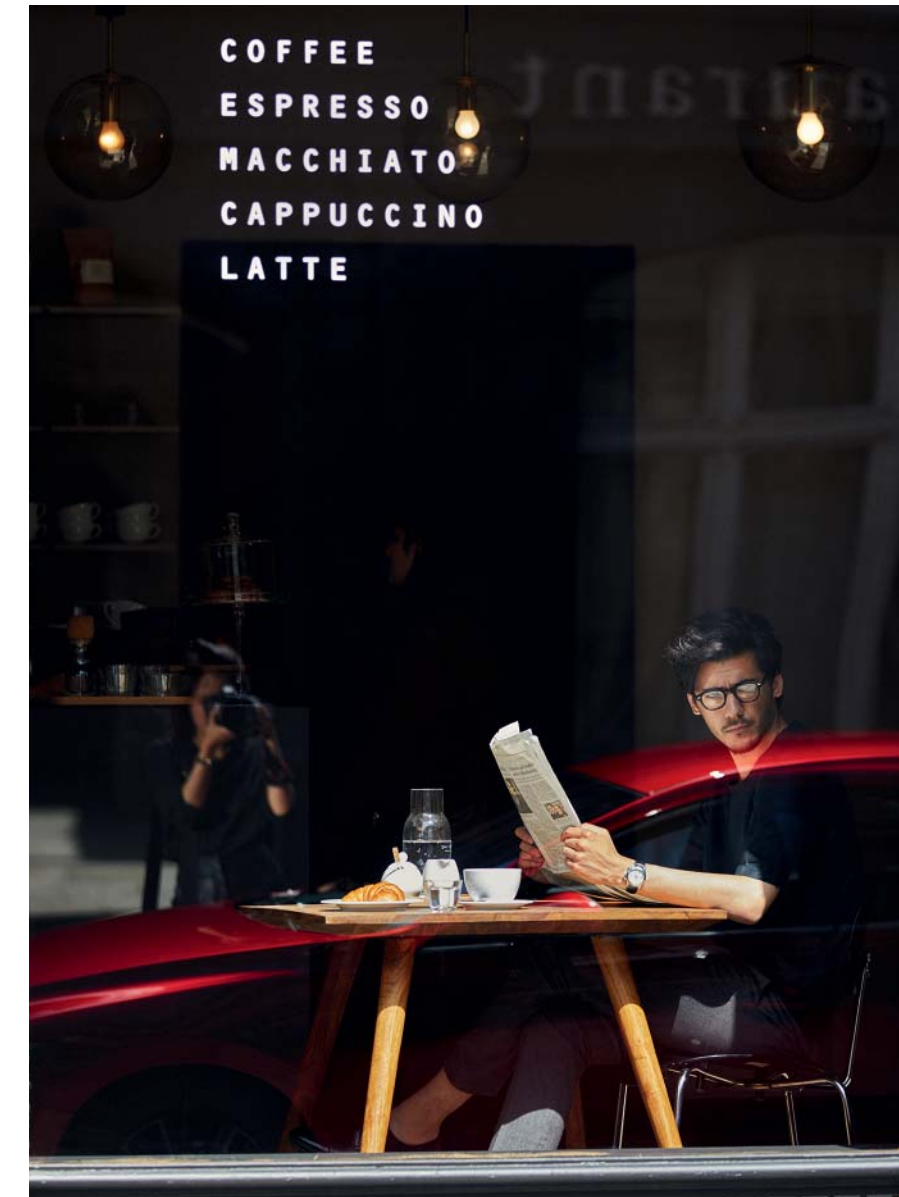
Bilden visar en Mazda3 Cosmo Hatchback