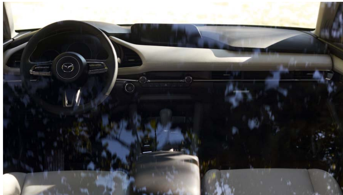
Bilden visar en Mazda3 Cosmo Sedan

Elegans: Definieras av ett stilrent utseende som varar över tid. Exemplifieras i 2022 Mazda3 Sedan med dess svepande, rena profil. Lockande proportioner som för tankarna till en klassisk coupé. Den eleganta stilen återspeglas också i den förstklassiga interiören. Ett utrymme som du ser fram emot spendera mer tid i. En intuitiv och ergonomisk förarupplevelse, vilken skapar ett förträffligt band mellan dig och din bil som kommer att vara över tid.