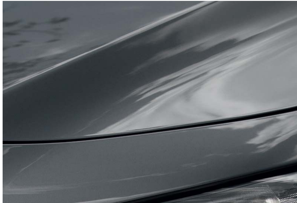
Machine Grey Metallic

På mazda.se hittar du alla våra kulörer och kan prova dig fram till din favoritnyans.