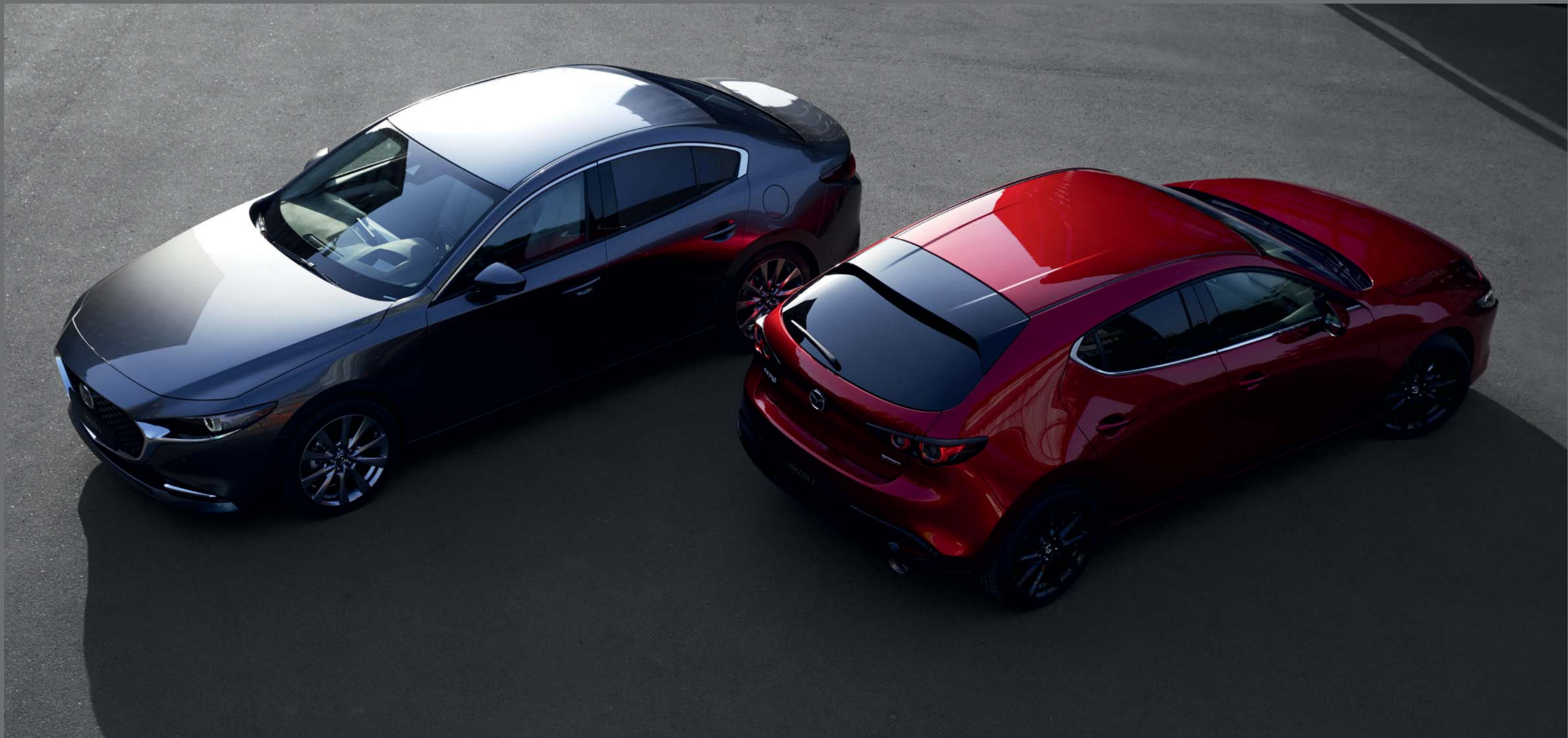
Bilden visar en Mazda3 Cosmo Sedan i färgen Machine Grey Metallic och en Mazda3 Cosmo Hatchback i färgen Soul Red Crystal Metallic