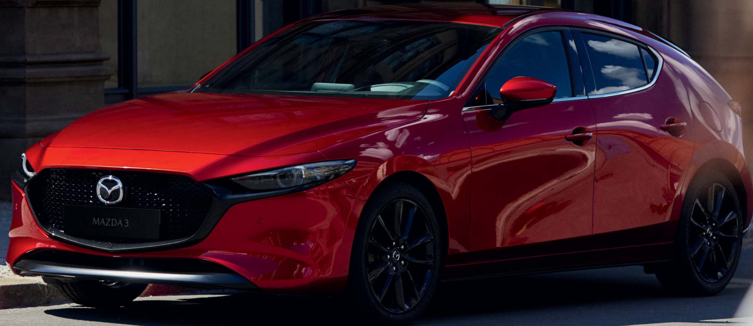
Bilden visar en Mazda3 Cosmo Hatchback