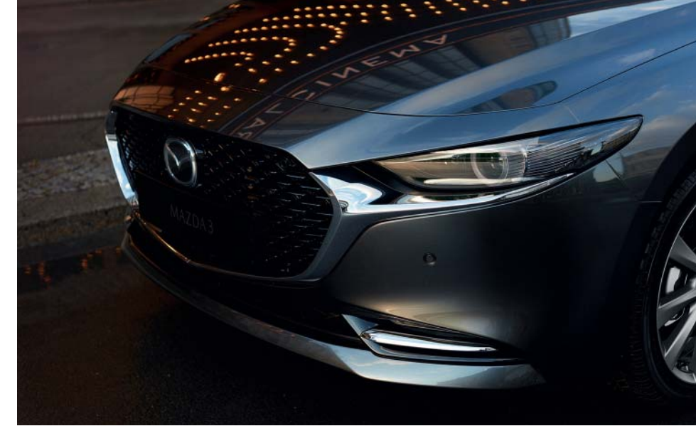
Bilden visar en Mazda3 Cosmo Sedan