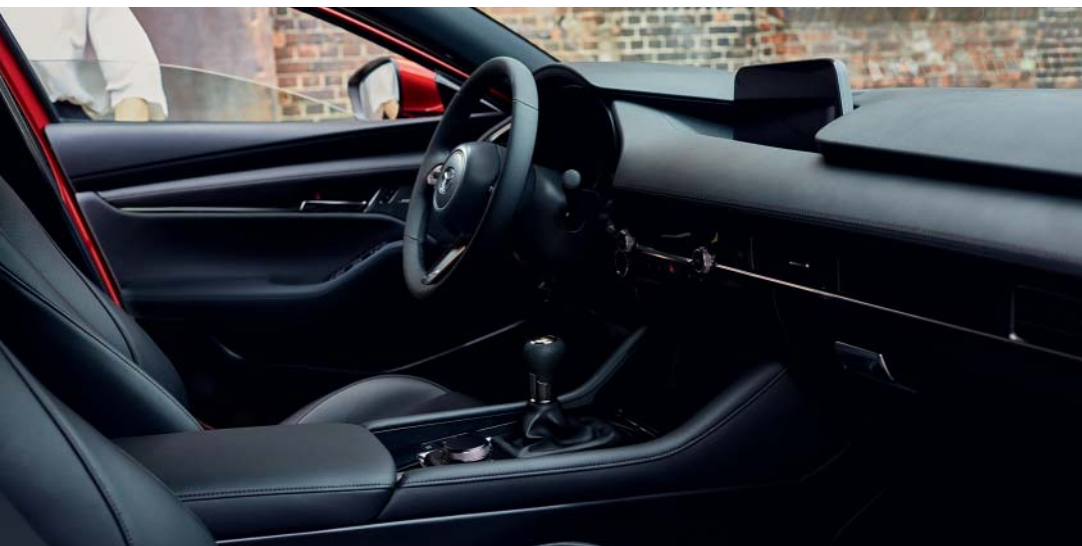
Bilden visar en Mazda3 Cosmo Hatchback

Inuti välkomnas du av en interiör design förfinad långt bortom bara praktiska funktioner. Inga detaljer har glömts bort. En intuitiv förarupplevelse väntar på dig där varje detalj har skapats med omtanke och precision. Våra designerns känslomässiga engagemang skapar ett starkt band mellan bilen och dess förare. Självsäker, pigg och energisk. Design och ingenjörskonst på en ny nivå.