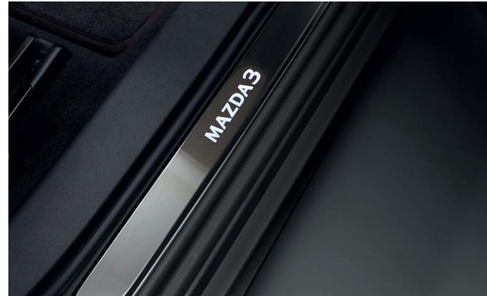
Instegslistor i borstad stål med belyst Mazda3-logotyp