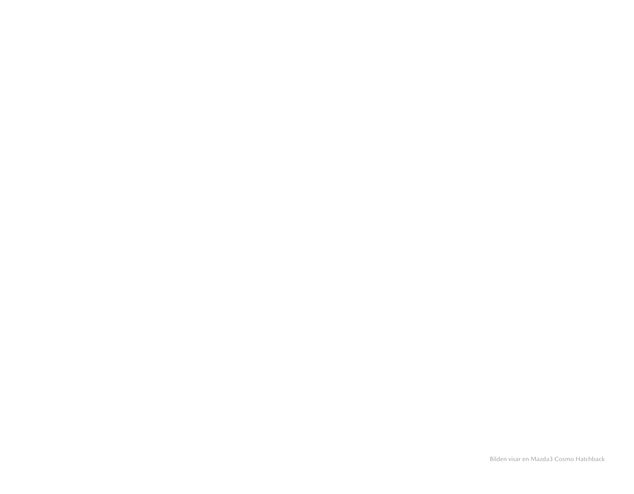
Bilden visar en Mazda3 Cosmo Hatchback