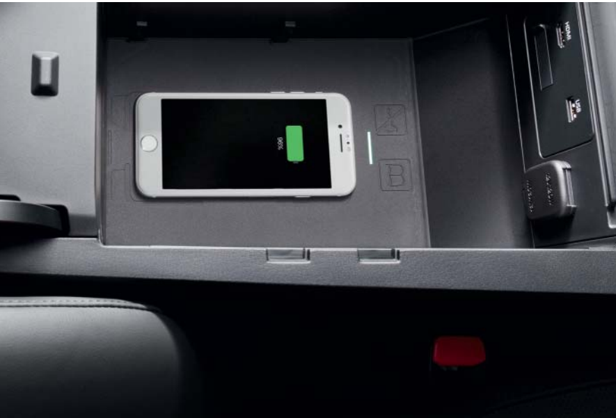
Induktiv, sladdlös mobilladdare

Självklart erbjuder vi ett stort urval av tillbehör för dig som vill ta upplevelsen ett steg längre. För en komplett beskrivning av alla tillbehör, besök mazda.se