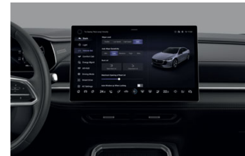
Ecran central avec système d'infodivertissement 14,6"