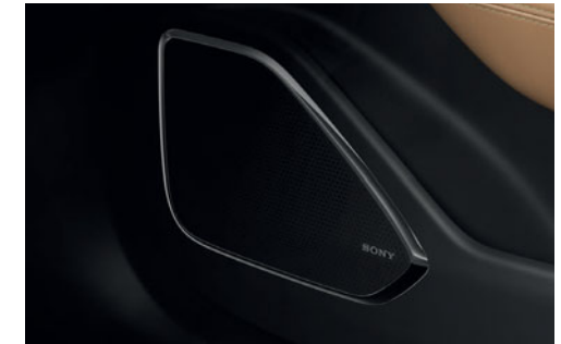
Système audio avec radio FM/DAB et 14 haut-parleurs Sony™