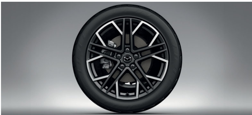
JANTES ALLIAGE 19" « DIAMOND CUT »