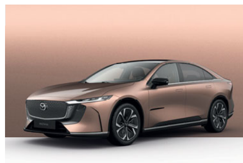
MELTING COPPER | 750 €