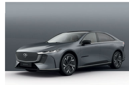
POLYMETAL GREY | 750 €