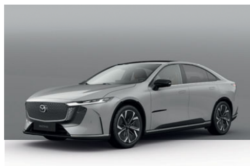
AERO GREY | 750 €