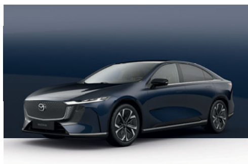
DEEP CRYSTAL BLUE | 750 €