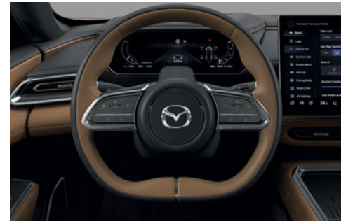
Volant gainé de cuir bi-ton