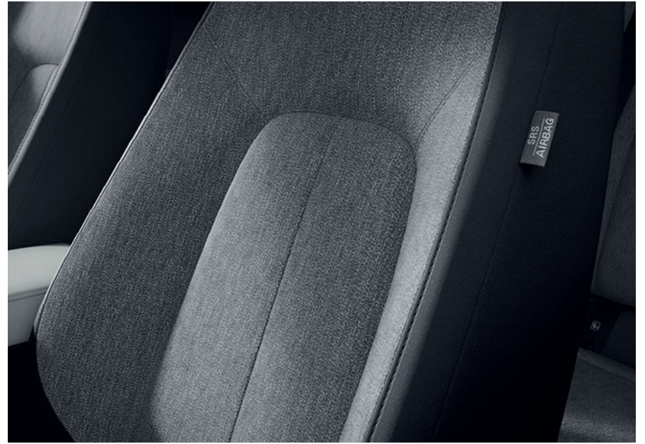
Tapicería de tela negra