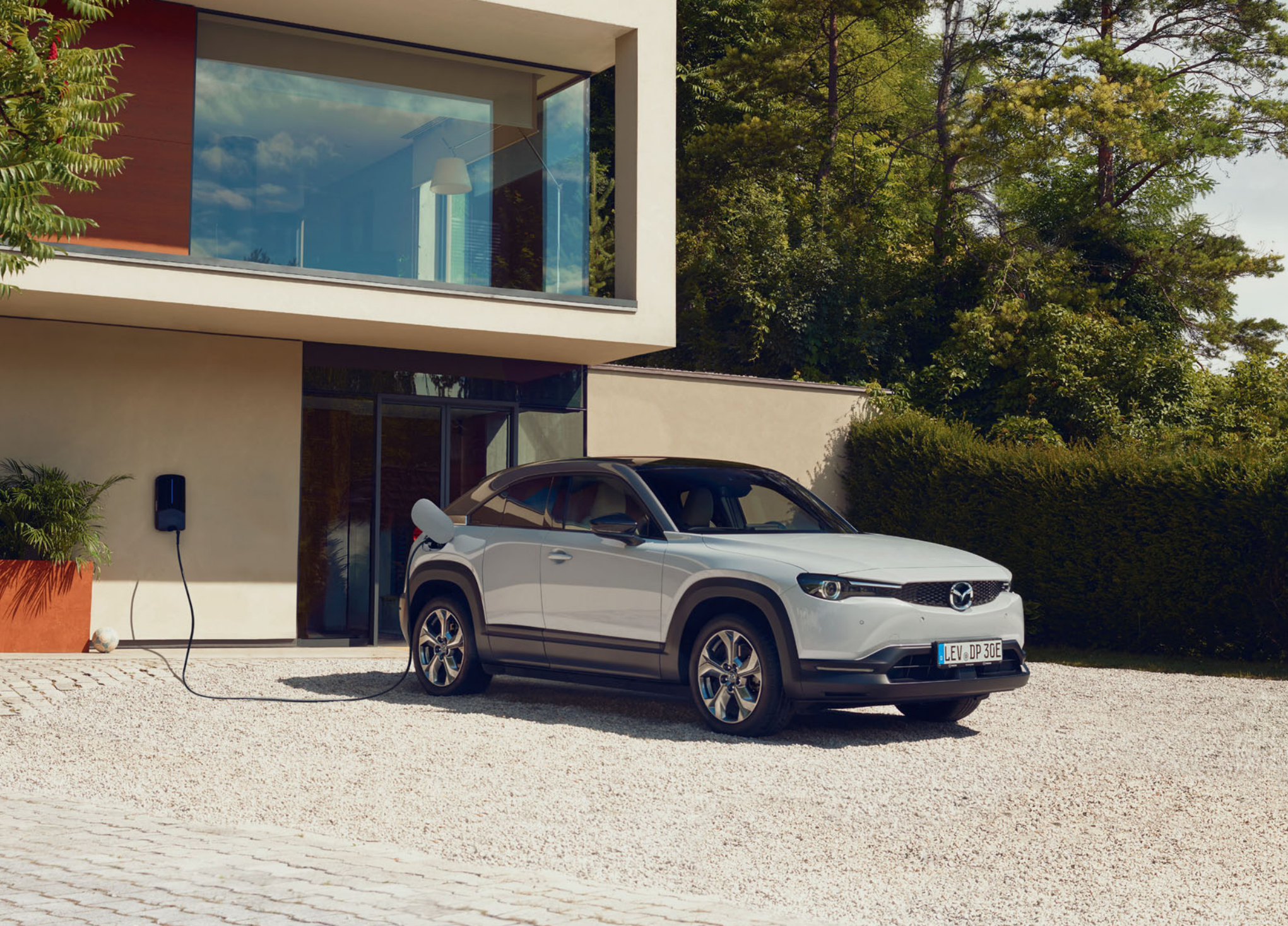
La imagen muestra un Mazda MX-30 en Multi-tone Ceramic White.