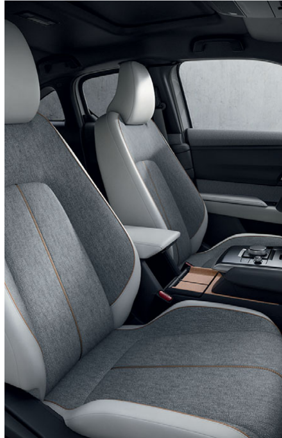
ACABADO MODERN CONFIDENCE