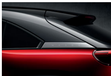
Multi-tone Soul Red Crystal