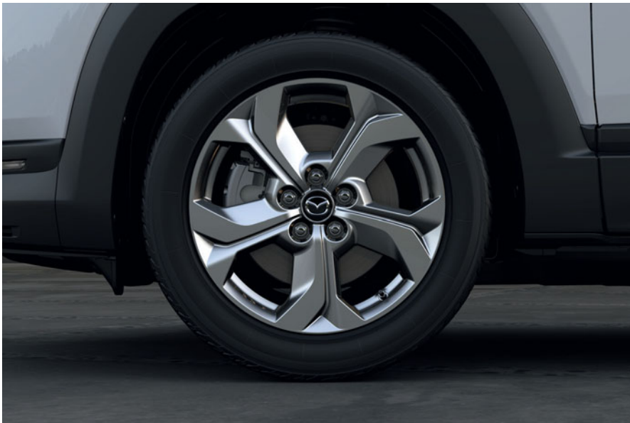
Llanta de 18" Bright

Nuestra selección de características configurables es reflejo de la creatividad con la que dotamos de naturalidad a la tecnología. En el interior, la opción Industrial Vintage combina la polipiel vintage y el tejido denim negro con corcho oscuro para transmitir confort y un ambiente acogedor. Los asientos opcionales Modern Confidence combinan tapicería de tela mélange con polipiel y corcho natural para recrear un entorno de materiales nobles y naturales. En el exterior, las llantas de 18" y otras opciones elegantes o funcionales contribuyen a mejorar la experiencia de conducción.