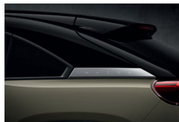
Multi-tone Zircon Sand