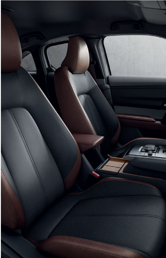
ACABADO INDUSTRIAL VINTAGE