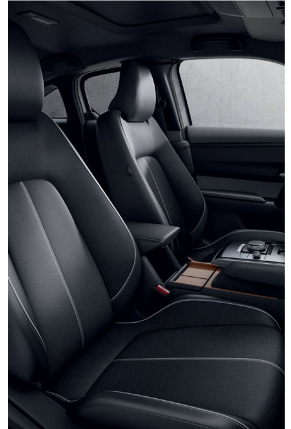
ACABADO URBAN EXPRESSION