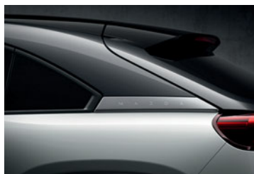
Multi-tone Ceramic White