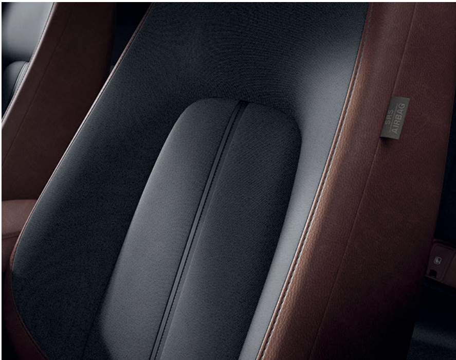
Tapicería Industrial Vintage