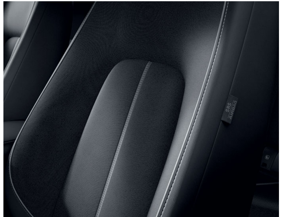
Tapicería Urban Expression