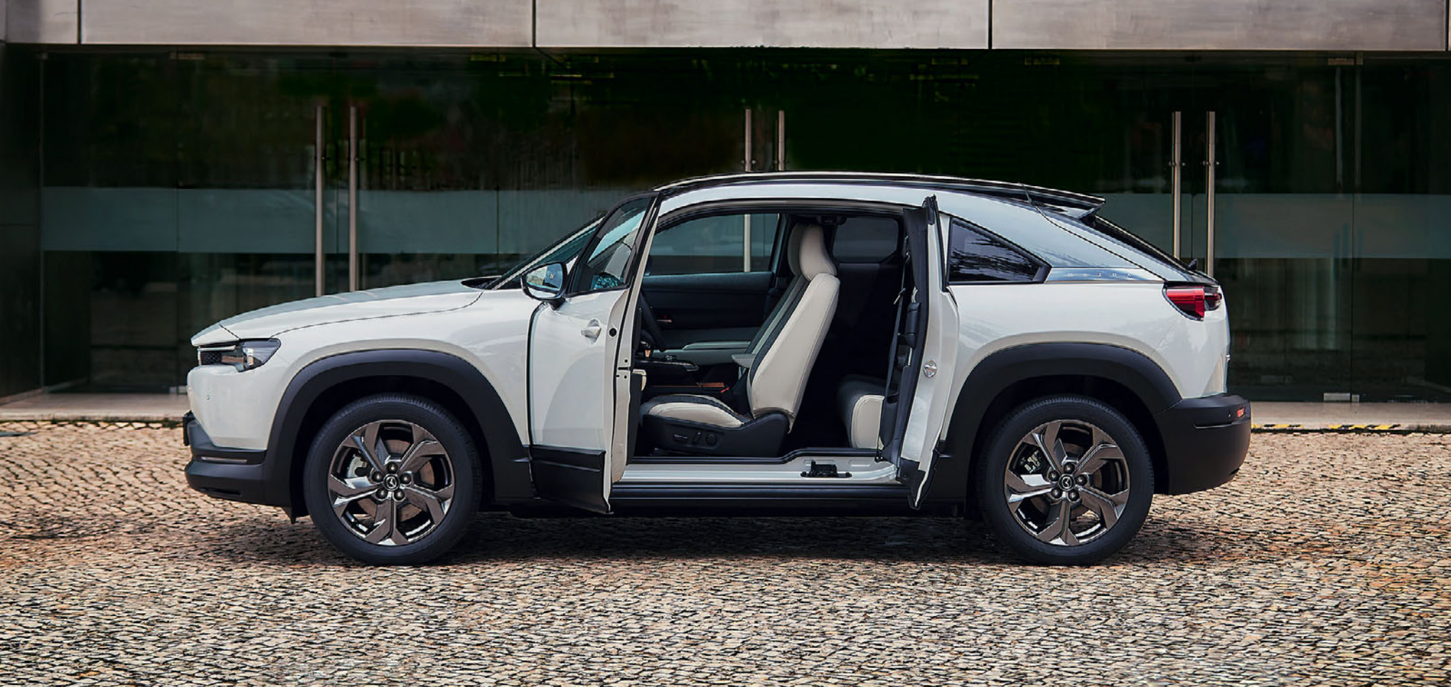
La imagen muestra el Mazda MX-30 en Multi-tone Ceramic White.