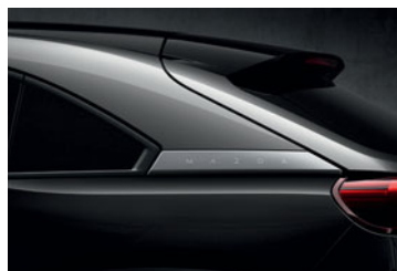
Multi-tone Jet Black-Silver