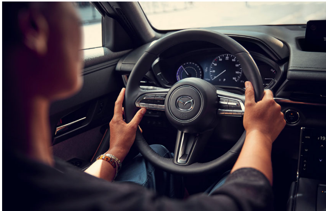
La imagen muestra el Mazda MX-30 en Multi-tone Ceramic White.