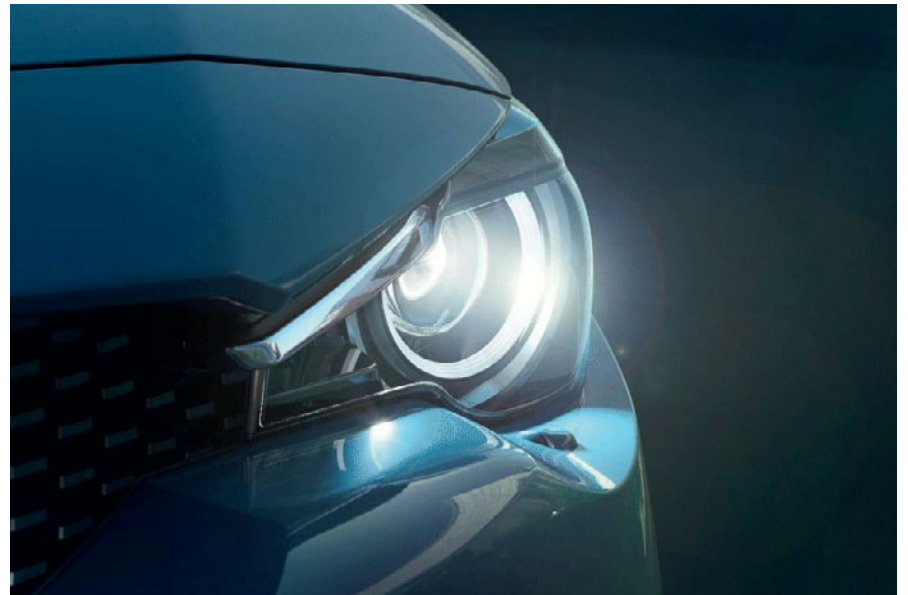
Faros Smart Full LED adaptativos (ALH)