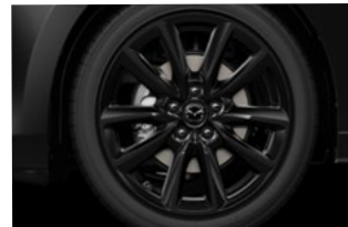
18" aluminiumsfælge, sorte, til • Mazda3 Homura • Mazda3 Nagisa • Mazda3 Centre-Line med Design Pack og e-Skyactiv X-motor • Mazda3 Exclusive-Line med e-Skyactiv X-motor • Mazda3 Takumi med e-Skyactiv X-motor