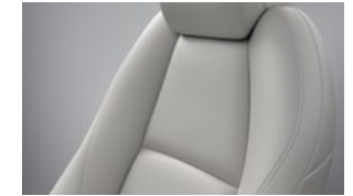
Hvidt læder til Mazda3 Sedan Takumi med e-Skyactiv X-motor