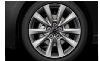
18" aluminiumsfælge, Bright Silver, til • Mazda3 Centre-Line med e-Skyactiv X-motor • Mazda3 Exclusive-Line med e-Skyactiv X-motor • Mazda3 Takumi med e-Skyactiv X-motor