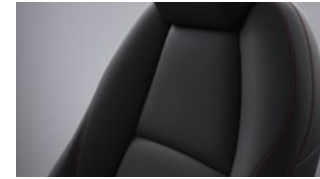
Sort stof med røde syninger til Mazda3 Homura.