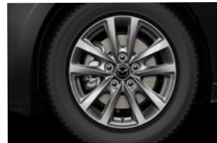
16" aluminiumsfælge, Silver, til • Mazda3 Prime-Line