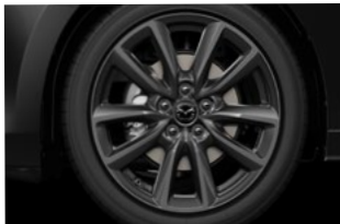
18" aluminiumsfælge, mørktonede, til • Mazda3 Centre-Line • Mazda3 Exclusive-Line med e-Skyactiv G-motor • Mazda3 Takumi med e-Skyactiv G-motor • Mazda3 Centre-Line med e-Skyactiv X-motor • Mazda3 Centre-Line med e-Skyactiv X-motor og Driver Assistance & Sound Pack