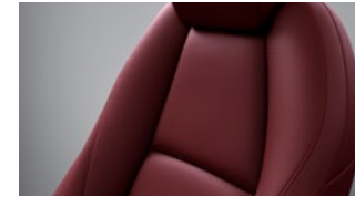
Rødt læder til Mazda3 Hatchback Takumi med e-Skyactiv X-motor