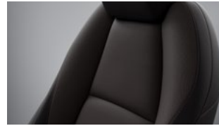
Sort stof til Mazda3 Prime-Line, Centre-Line og Exclusive-Line