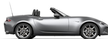
MACHINE GREY (46G) 4)