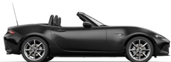
JET BLACK (41W) 3)