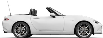
ARCTIC WHITE (A4D)