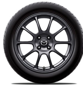
RAYS® 16-Zoll-Leichtmetallfelgen geschmiedet