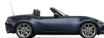
DEEP CRYSTAL BLUE (42M) 3)

1) Sitzmittelbahn und -wangen in Leder 2) Sitzmittelbahn in Alcantara®-Stoff. Sitzwangen und Kopfstützen in Leder. 3) Metallic-Lackierung 4) Sonderfarbe