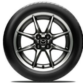
16-Zoll-Leichtmetallfelgen Bright Dark