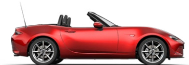
SOUL RED CRYSTAL (46V) 4)