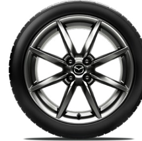
17-Zoll-Leichtmetallfelgen Bright Dark