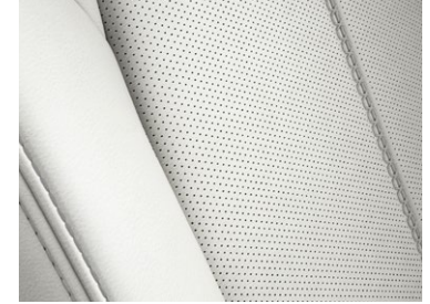
Nappalederausstattung 1) Weiß