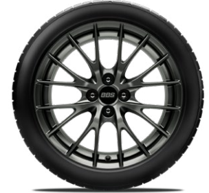
BBS® 17-Zoll-Leichtmetallfelgen geschmiedet