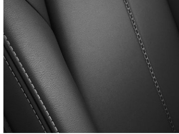
Lederausstattung 1) Schwarz