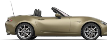
ZIRCON SAND (48T) 3)