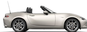
PLATINUM QUARTZ (47S) 3)