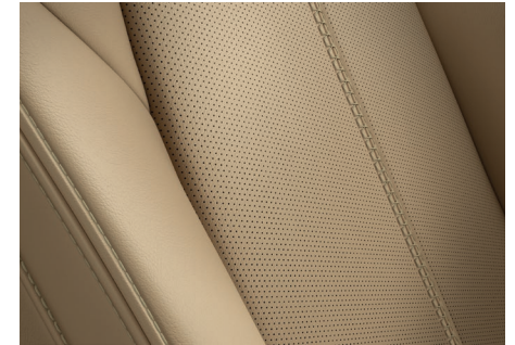
Nappalederausstattung 2) Beige