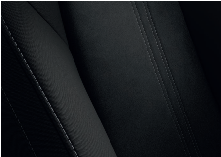
Teil-Kunstlederausstattung 1) Schwarz