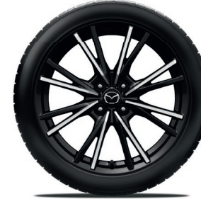
17-Zoll-Leichtmetallfelgen mit Diamantschliff