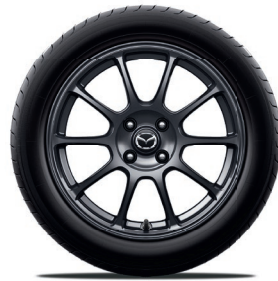
RAYS® 16-Zoll-Leichtmetallfelgen geschmiedet