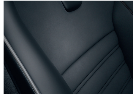
RECARO® Sportsitze 3)