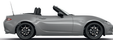
AERO GREY (52C) 4)