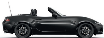
JET BLACK (41W) 4)