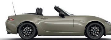
ZIRCON SAND (48T) 4)