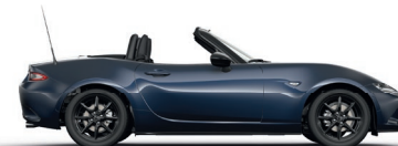
DEEP CRYSTAL BLUE (42M) 4)

1) Sitzmittelbahn in Leganu® Kunstleder. Sitzwangen und Kopfstütze in Stoff. 2) Sitzmittelbahn und -wangen in Leder 3) Sitzmittelbahn in Alcantara®-Stoff. Sitzwangen und Kopfstützen in Leder. 4) Metallic-Lackierung 5) Sonderfarbe