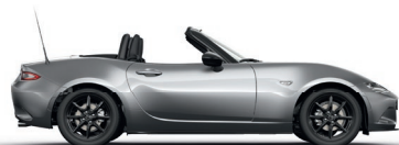
MACHINE GREY (46G) 5)