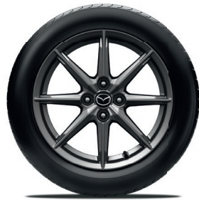
16-Zoll-Leichtmetallfelgen Bright Dark