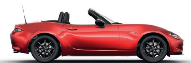
SOUL RED CRYSTAL (46V) 5)