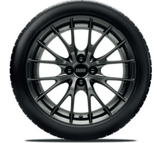
BBS® 17-Zoll-Leichtmetallfelgen geschmiedet