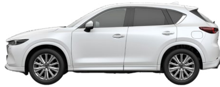
RHODIUM WHITE (51K) 2)