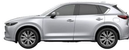
SONIC SILVER (45P) 1)