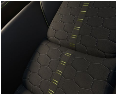
Sitze mit Grand Luxe®/Kunstlederkombination mit Grüngelb-Akzenten (Newground)