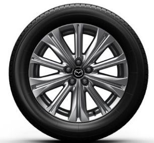
19-Zoll-Felge Silber: Takumi