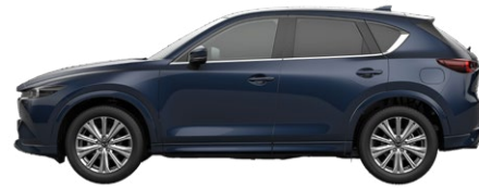
DEEP CRYSTAL BLUE (42M) 1)