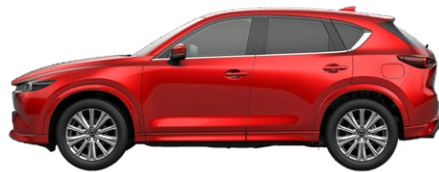
SOUL RED CRYSTAL (46V) 2)