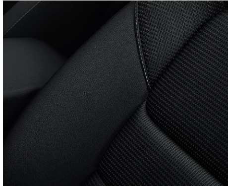
Stoff mit Streifenmuster