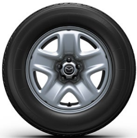
17-Zoll-Stahlfelge mit Radzierblende