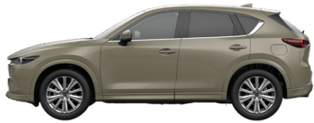
ZIRCON SAND (48T) 1)