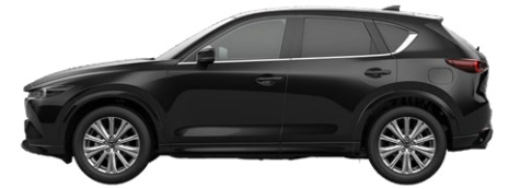
JET BLACK (41W) 1)