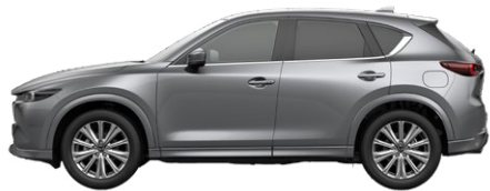
MACHINE GREY (46G) 2)