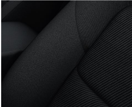
Stoff mit Wellenmuster