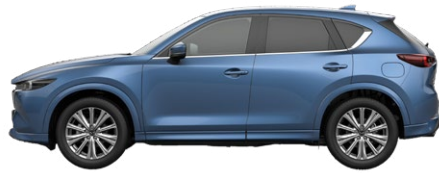
ETERNAL BLUE (45B) 1)