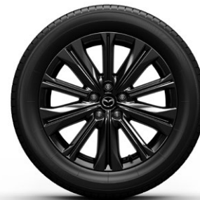
19-Zoll-Felge Schwarz: Homura