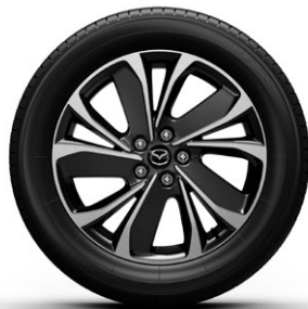
19-Zoll-Felge: Ad'vantage, Newground, Exclusive-Line