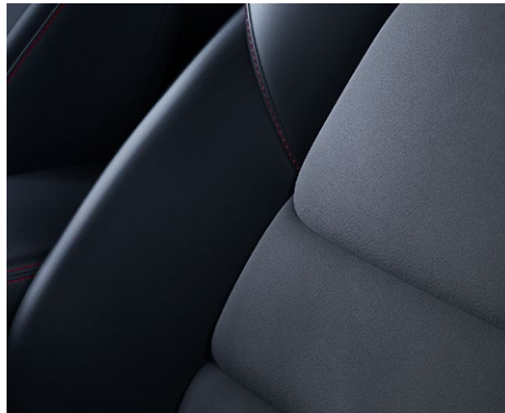
Sitze mit Grand Luxe®/Kunstlederkombination mit roten Nähten (Homura)