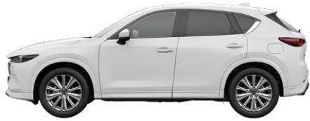
ARCTIC WHITE (A4D)