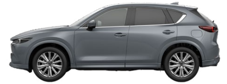
POLYMETAL GREY (47C) 2)