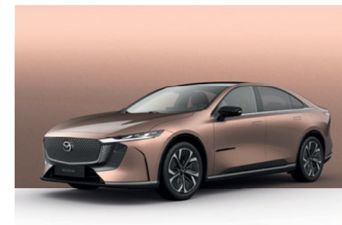
MELTING COPPER | 19 500 Kč