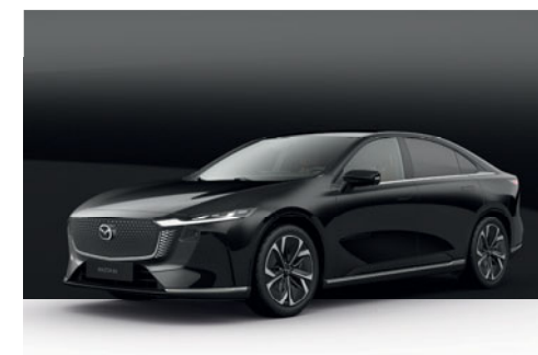
JET BLACK | 19 500 Kč

Pomocí našeho konfiguratoru vozů pro sebe najdete dokonalou Mazdu6e