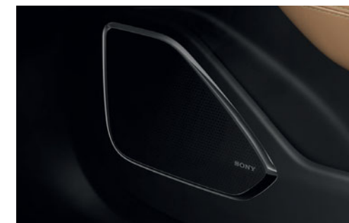
Audiosystém Sony se 14 reproduktory