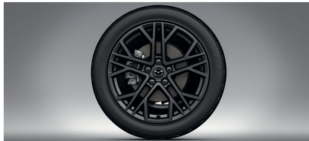
LITÉ DISKY KOL 19", DESIGN 77, LESKLÉ ANTRACITOVÉ