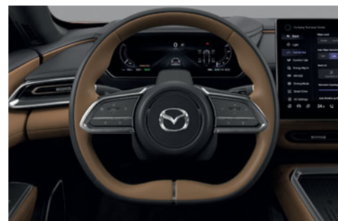
Kožený volant, kombinace dvou barev