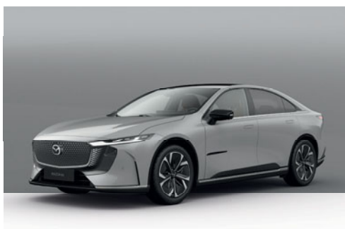
AERO GREY | 19 500 Kč