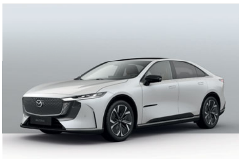
CRYSTAL WHITE PEARL | 0 Kč