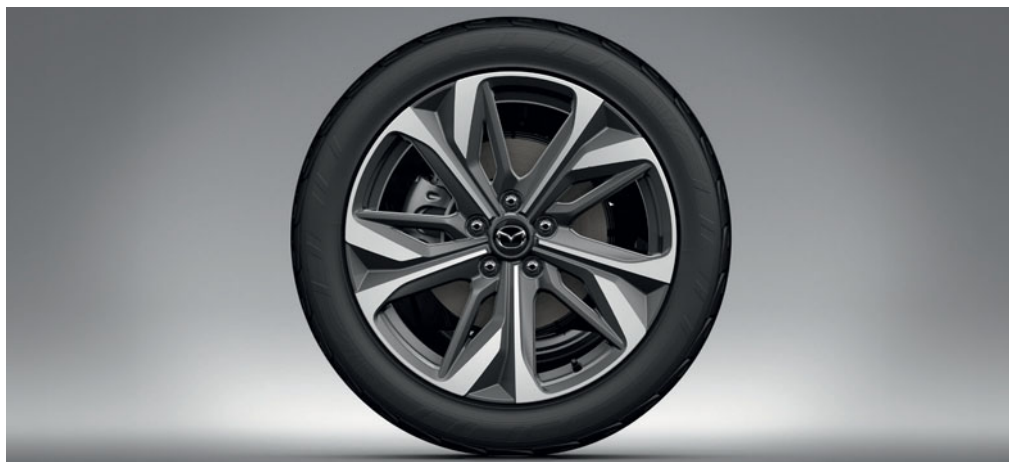
LITÉ DISKY KOL 19", DESIGN 180