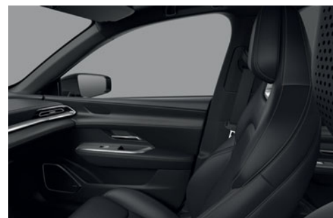
Umělá kůže – černá (černý strop)