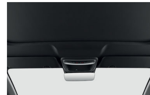
Elektricky ovládaná clona střešního okna