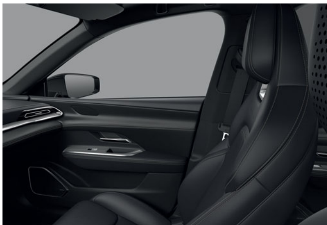
Umělá kůže – černá (černý strop)