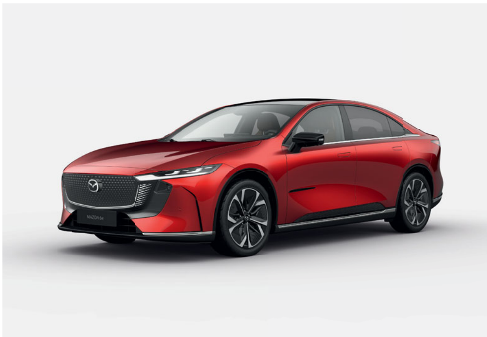
Na tomto snímku je Mazda6e v barvě Soul Red Crystal