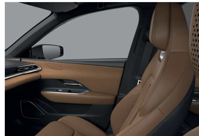
Sedadla potažená hnědou kůží Nappa a semišem