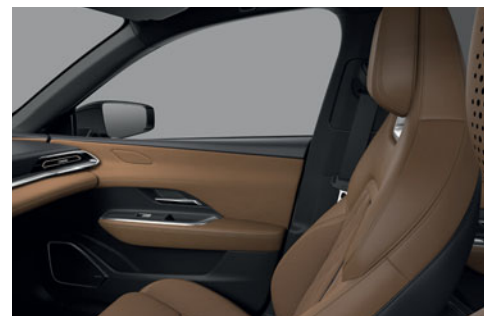
Sedadla potažená hnědou kůží Nappa a semišem