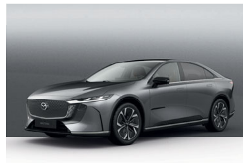
MACHINE GREY | 23 500 Kč