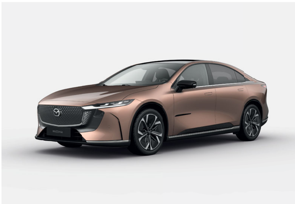
Na tomto snímku je Mazda6e v barvě Melting Copper