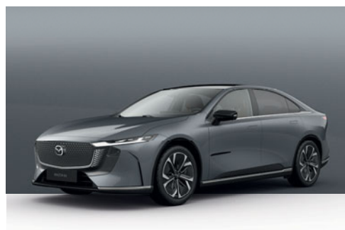
POLYMETAL GREY | 19 500 Kč