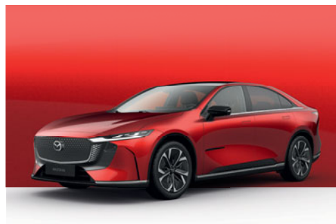
SOUL RED CRYSTAL | 27 500 Kč