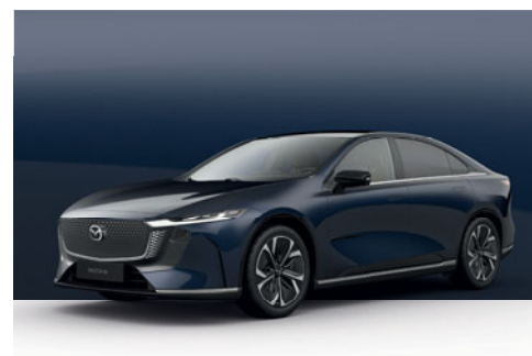
DEEP CRYSTAL BLUE | 19 500 Kč