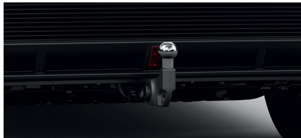
SKLOPNÉ TAŽNÉ ZAŘÍZENÍ, PLNĚ ELEKTRICKÉ, VČETNĚ ELEKTROINSTALACE