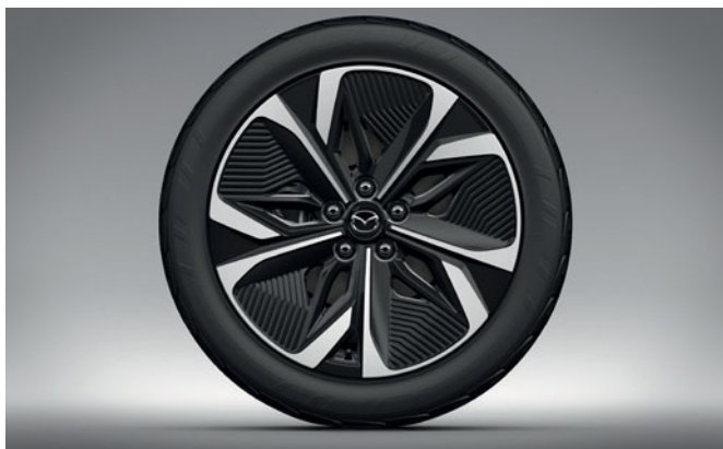
19" aerodynamická hliníková kola – (245/45R19 Michelin)