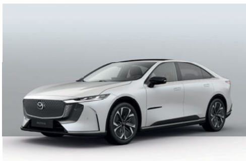
CRYSTAL WHITE PEARL | 0 Kč