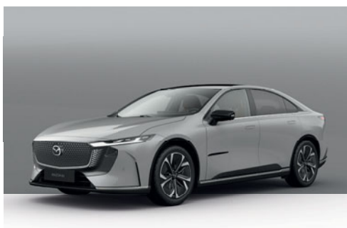
AERO GREY | 19 500 Kč