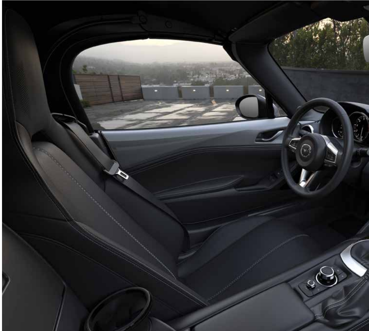
Sellerie en cuir noir avec surpiqûres 'Silver' et revêtement du tableau de bord en similicuir noir avec surpiqûres 'Silver'