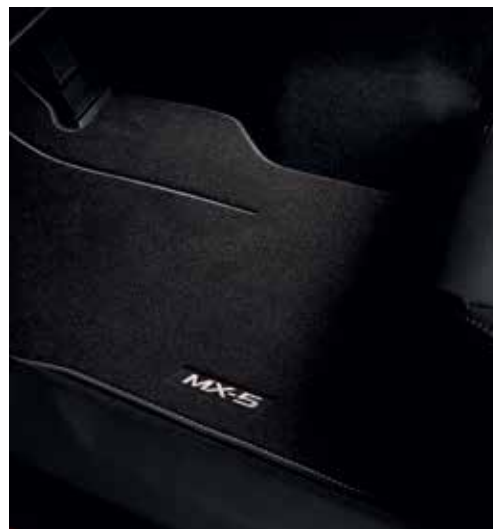
Tapis de sol « Luxe »