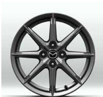
Jantes en alliage 'Bright' 16" avec pneus 195/50 R16 sur EXCLUSIVE-LINE & KAZARI