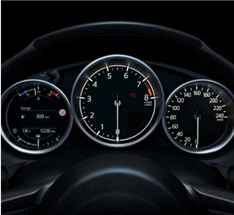
Ordinateur de bord avec écran TFT 4,6" en couleur