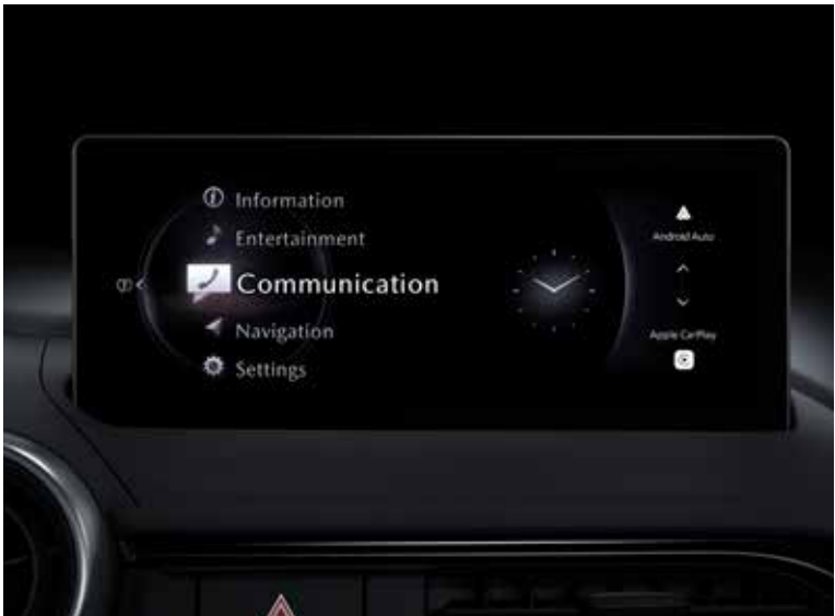
HMI Commander et Mazda Connect avec écran couleur tactile 8.8"