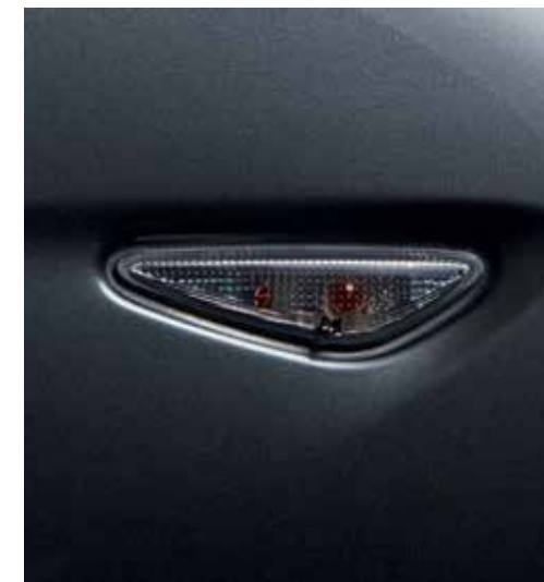
Indicateurs latéraux (verre "smoked")