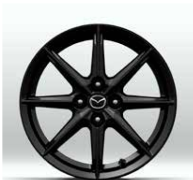
Jantes en alliage 'Black Metallic' 16" avec pneus 195/50 R16 sur PRIME-LINE