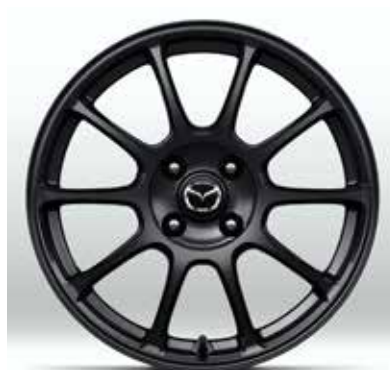
Jantes en alliage RAYS forged 16" avec pneus 195/50 R16 sur HOMURA