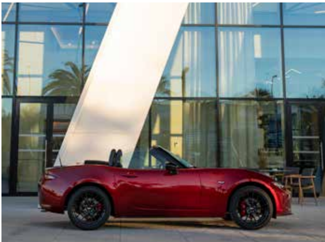
Mazda MX-5 Roadster Homura