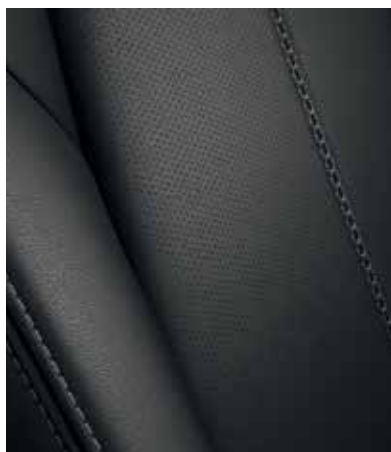
Sellerie en cuir noir avec surpiqûres 'Silver' (EXCLUSIVE-LINE)