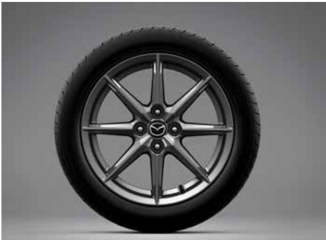
Jantes en alliage 'Bright' 16" avec pneus 195/50 R16