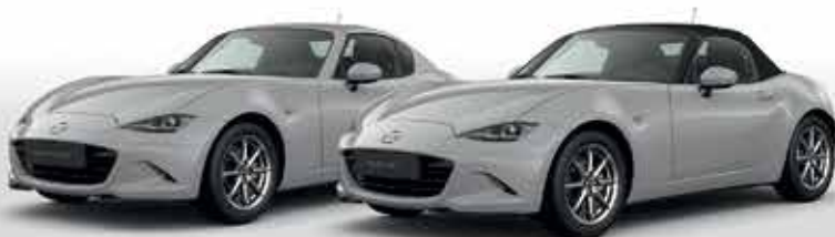
AERO GREY (52C)*