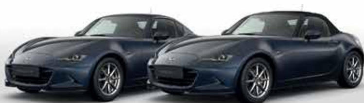
DEEP CRYSTAL BLUE (42M)*