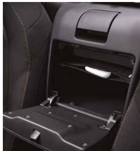
Filet d'étagère de console