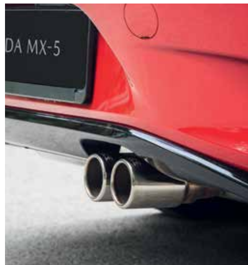
Échappement sport Bastuck