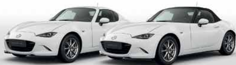
ARCTIC WHITE (A4D)