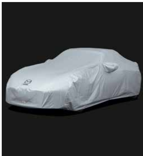
Housse complète de protection de voiture extérieure