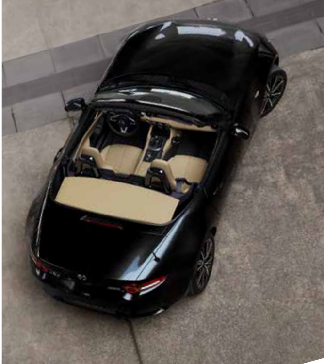
Capote souple beige avec isolation à ouverture manuelle (Roadster)