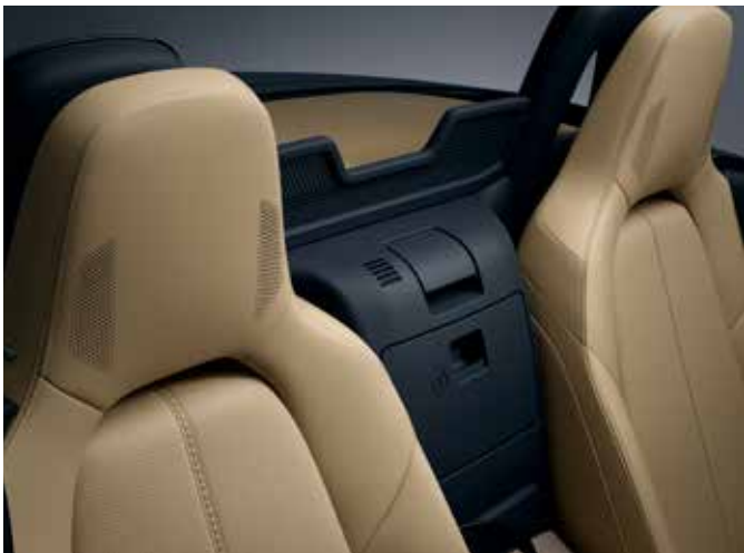
Système audio Bose® avec 9 haut-parleurs