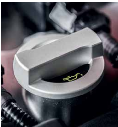
Bouchon de remplissage d'huile (argent)