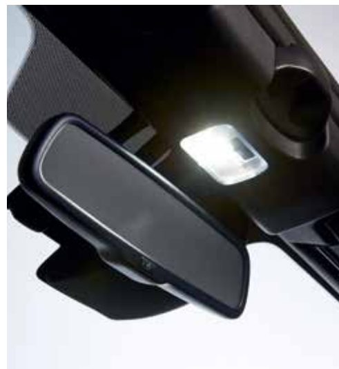
Éclairage intérieur LED