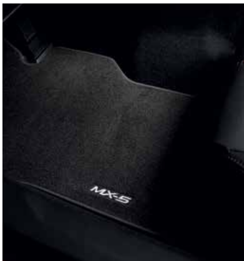
Tapis de sol « Standard »