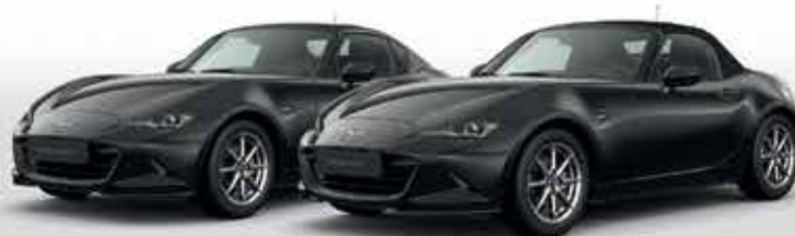
JET BLACK (41W)*