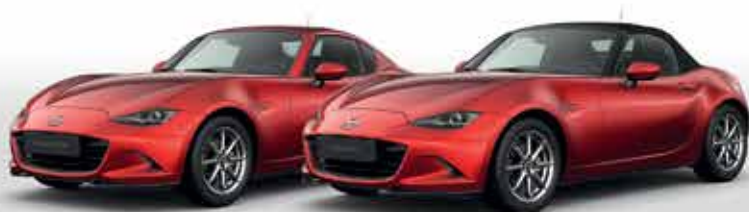
SOUL RED CRYSTAL (46V)*