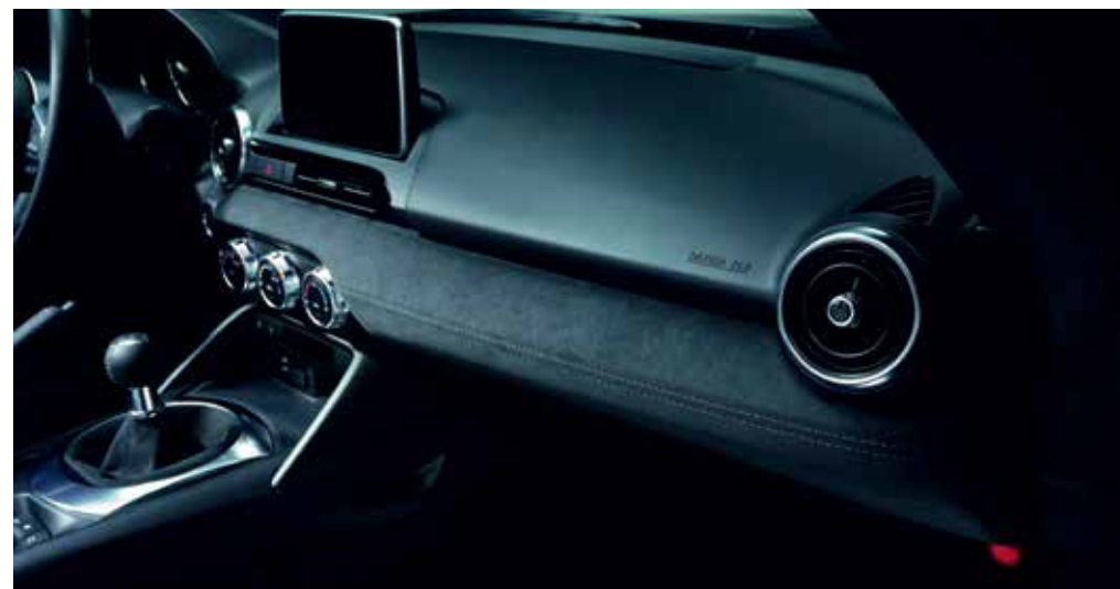
Panneau de porte inférieur, panneau du tableau de bord, soufflet du frein à main et soufflet du levier de changement de vitesses en Alcantara®