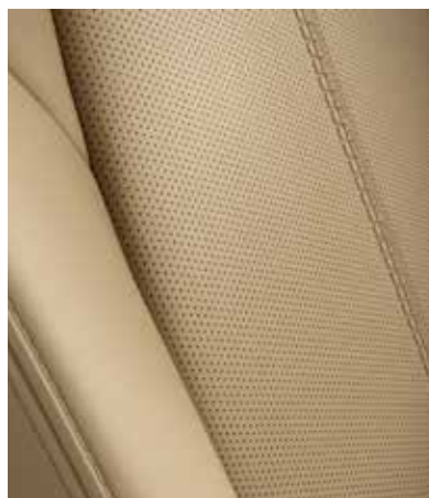
Sellerie en cuir Nappa Tan avec surpiqûres contrastantes (KAZARI)