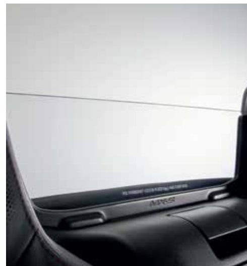
Saut de vent transparent (uniquement sur Roadster)