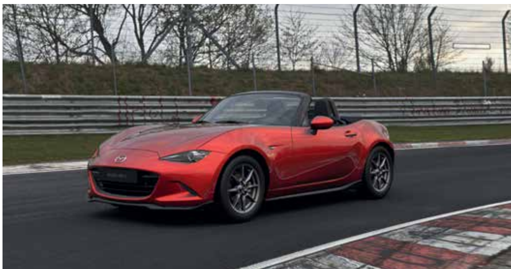
Jupes latérales, aileron de coffre, jupe avant, jupe de bouclier arrière