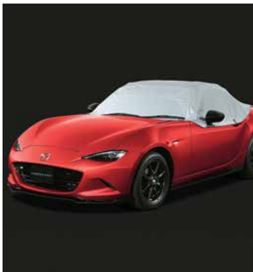
Demi-housse de protection de voiture extérieure (uniquement sur Roadster)