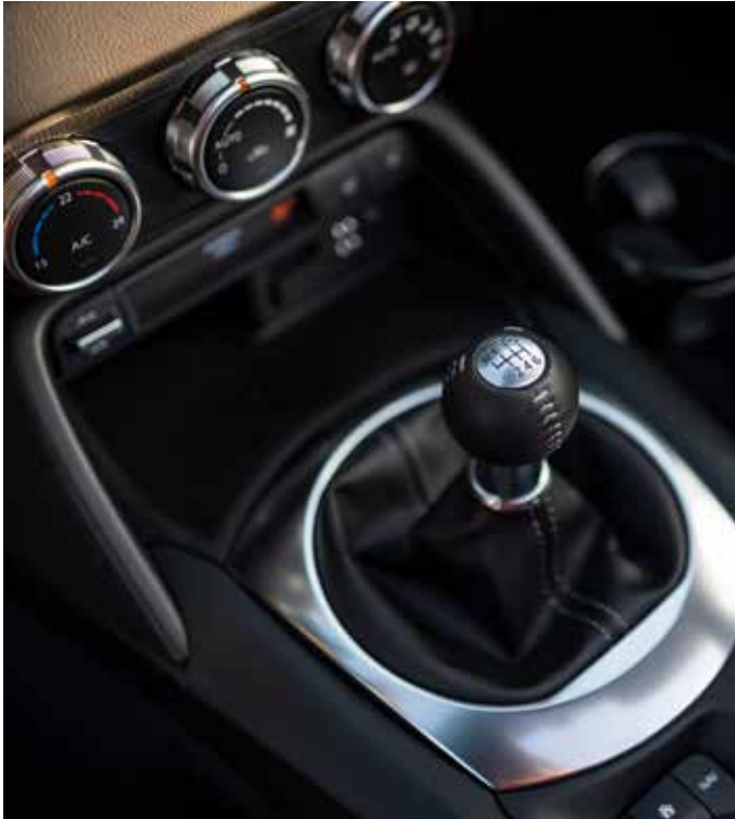
Climatisation automatique, Sièges chauffants à l'avant et pommeau du levier de vitesse gainés de cuir avec surpiqûres 'Silver'