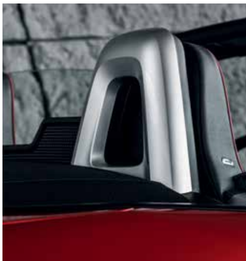
Coques de rétroviseur, revêtement fashion bar et garniture de montant avant argentés (uniquement sur Roadster)