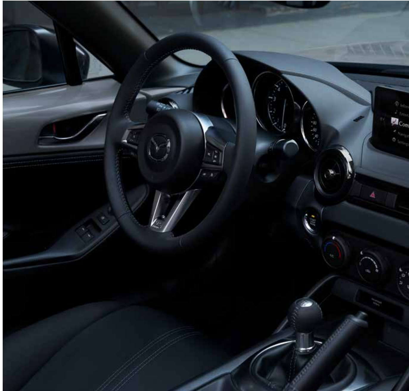
Sellerie en tissu noir et suédine noir avec surpiqûres 'Silver'