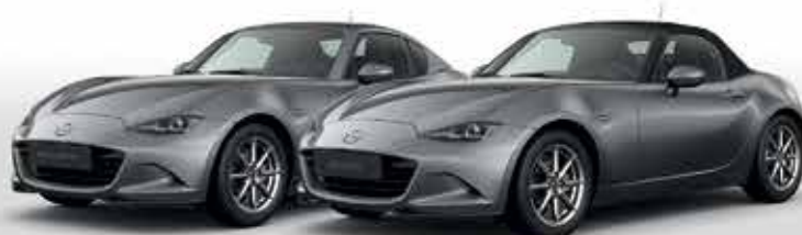
MACHINE GREY (46G)*