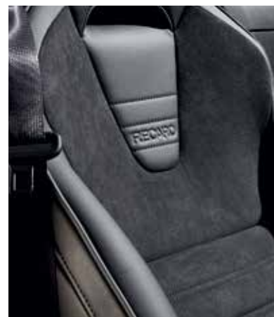
Sièges Recaro®* avec revêtement en cuir noir, Alcantara® noir, surpiqûres 'Silver' et passepoil gris (HOMURA)