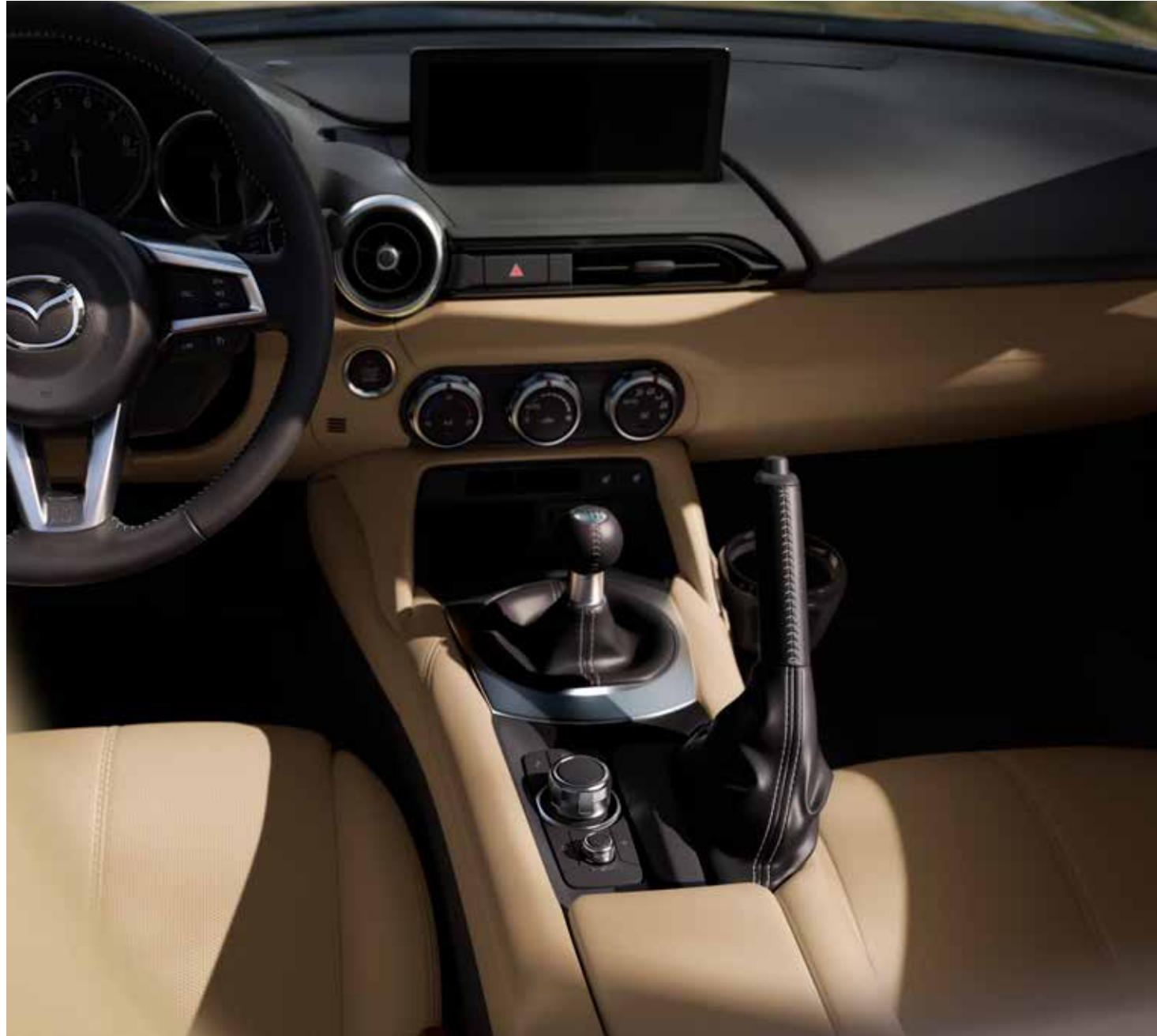
Sellerie en cuir Nappa Tan avec surpiqûres contrastantes