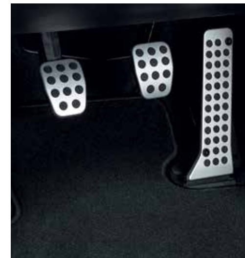
Pédales en aluminium