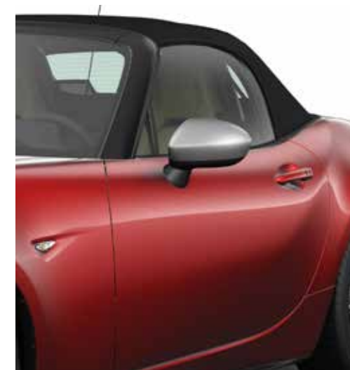
Coques de rétroviseur (argentée)