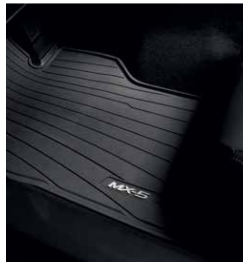
Tapis de sol « Caoutchouc »