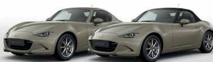
ZIRCON SAND (48T)*