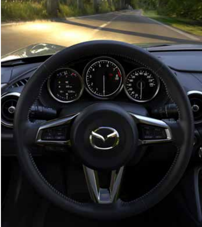
Volant et pommeau du levier de vitesse gainés de cuir avec surpiquûres 'Silver' et commandes audio intégrées au volant