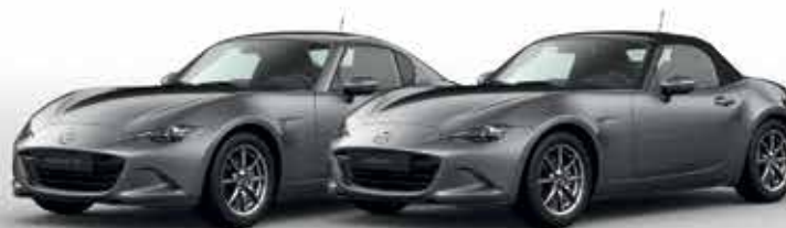
MACHINE GREY (46G)*