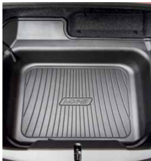
Protection de coffre