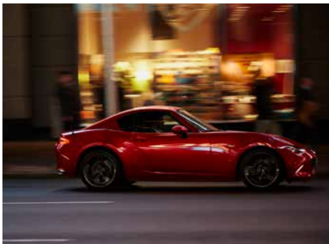
Mazda MX-5 Homura RF