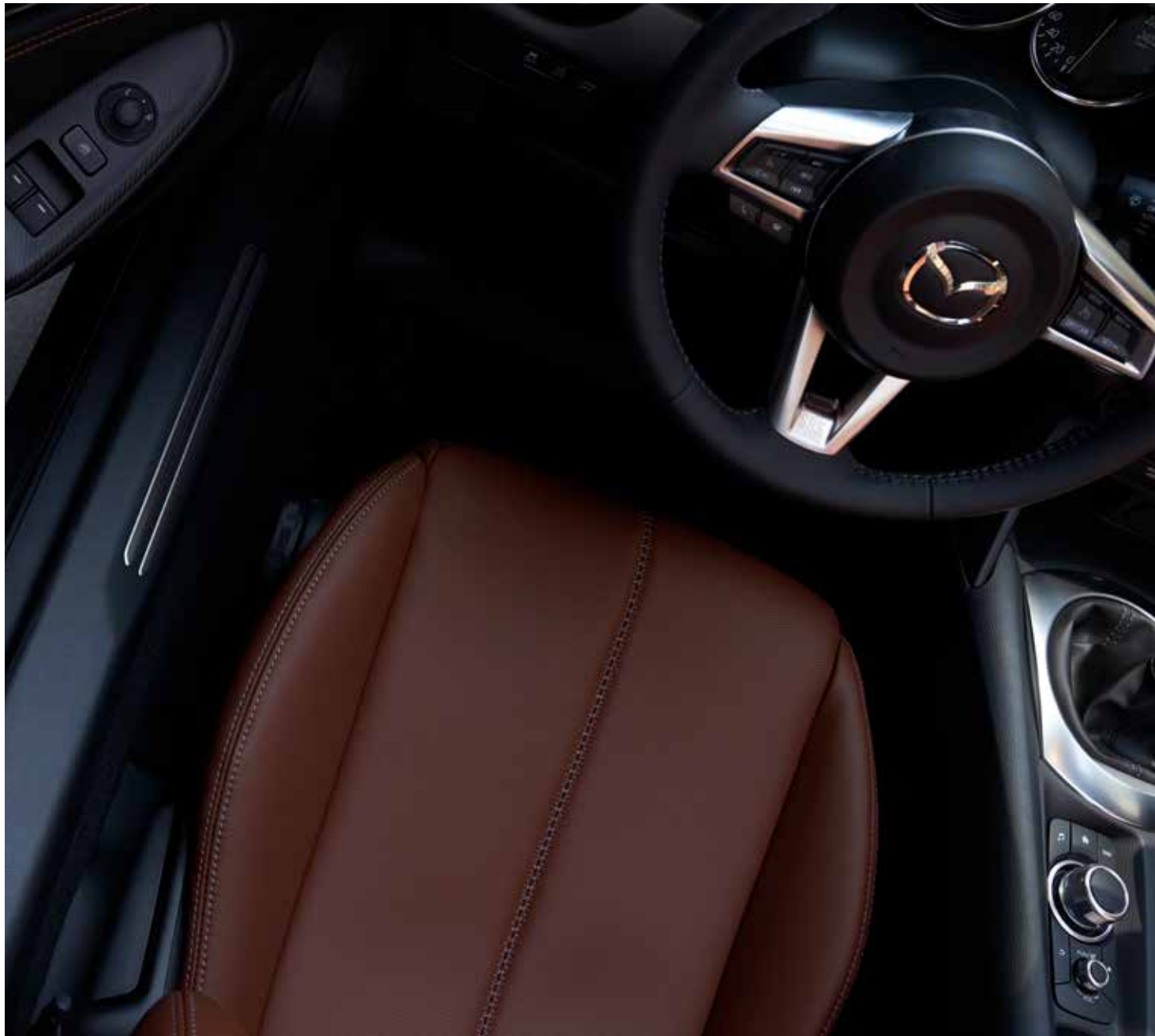
Sellerie en cuir Nappa 'Terracotta' avec surpiqûres 'Silver' et revêtement du tableau de bord en similicuir noir avec surpiqûres 'Terracotta'