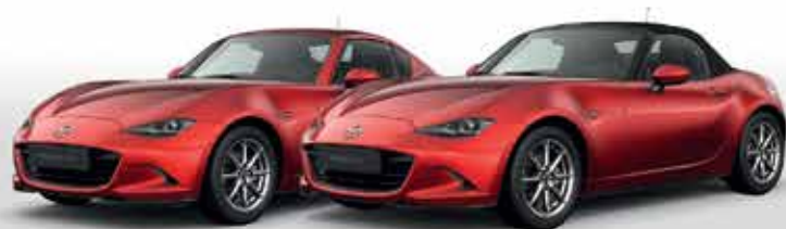
SOUL RED CRYSTAL (46V)*