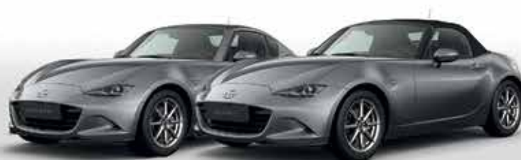
MACHINE GREY (46G)*