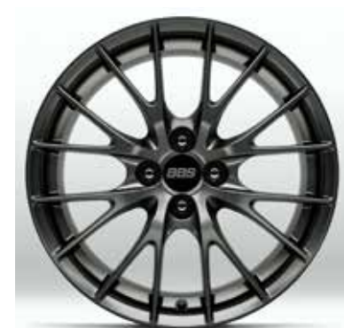
Jantes en alliage BBS 17" pour pneus 205/45 R17 sur HOMURA (uniquement sur Skyactiv-G 184 ch)