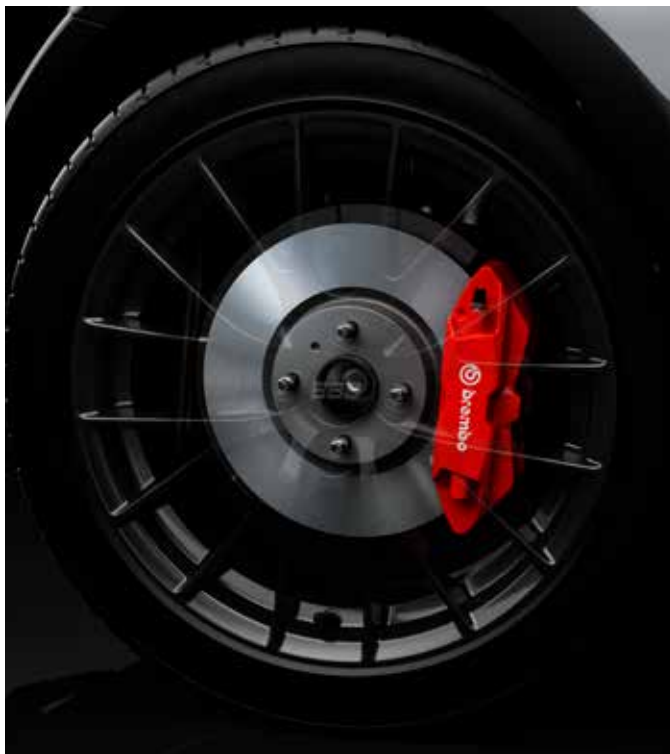
Jantes en alliage BBS 17" avec pneus 205/45 R17 et freins Brembo™ (uniquement sur SKYACTIV-G 184 ch)