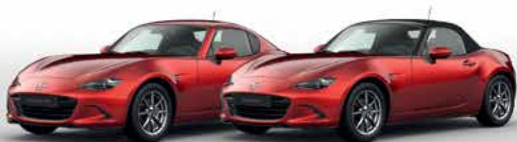
SOUL RED CRYSTAL (46V)*