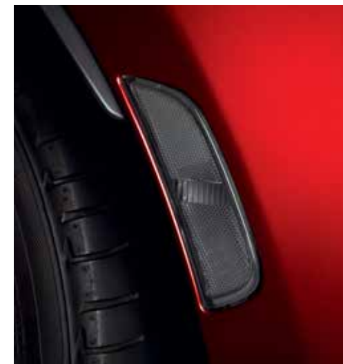
Réflecteurs latéraux (gris)