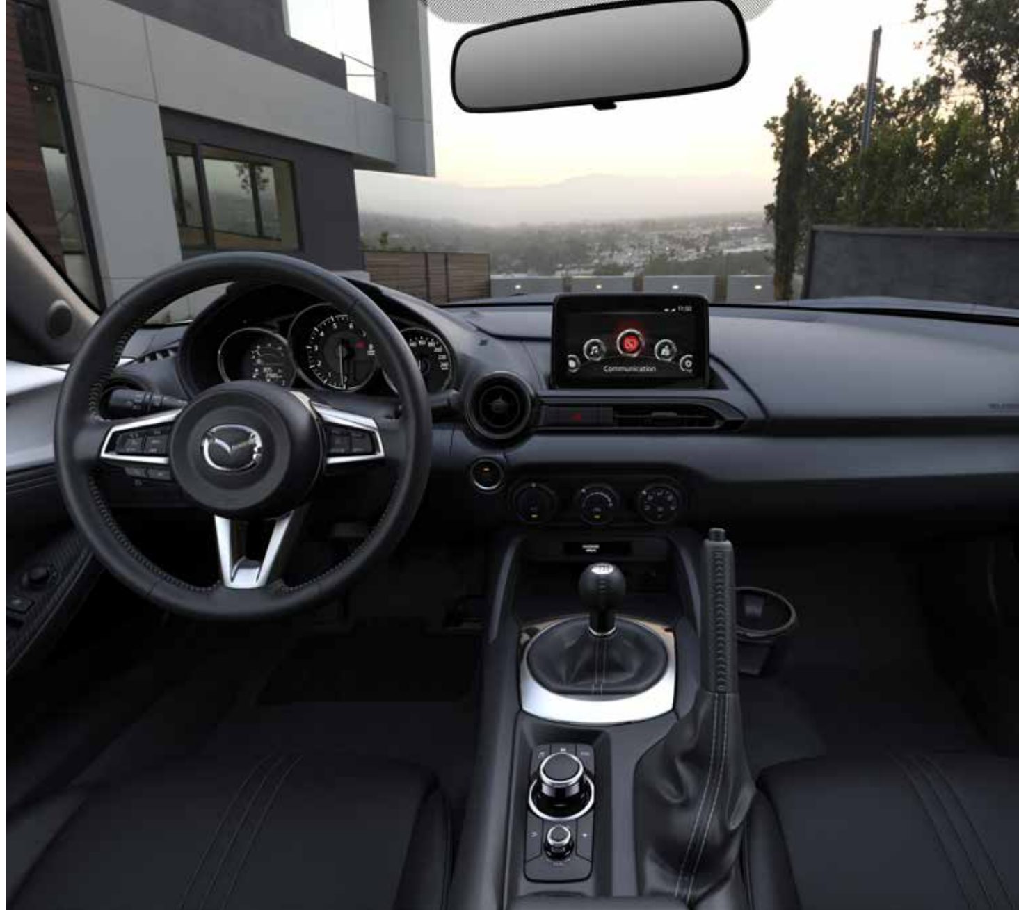
Sellerie en tissu noir avec surpiqûres 'Silver'