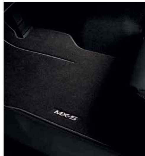
Tapis de sol « Luxe »