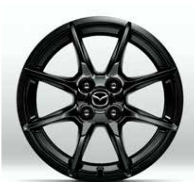
Jantes en alliage 'Black' 16" pour pneus 195/50 R16 sur PRIME-LINE