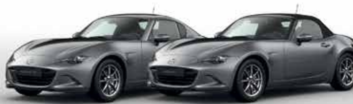
MACHINE GREY (46G)*