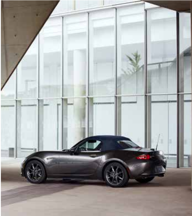
Capote bleue souple avec isolation à ouverture manuelle (uniquement sur Roadster)