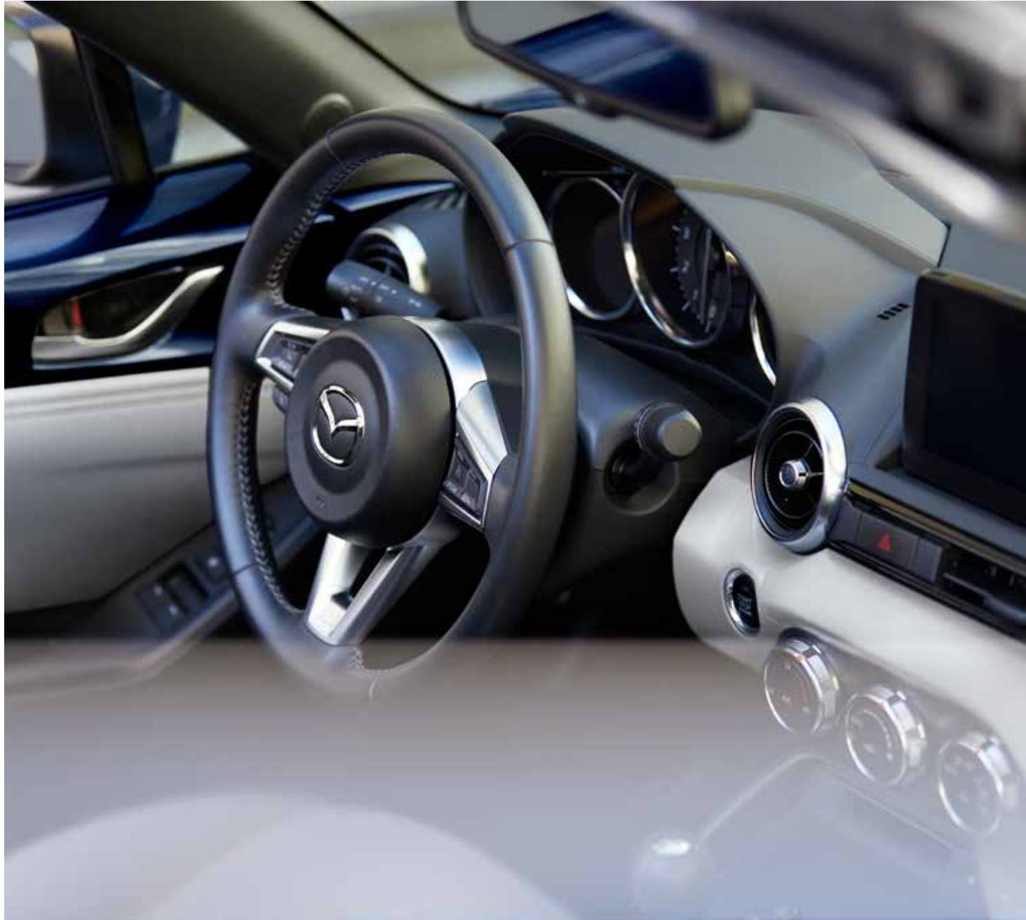
Sellerie en cuir Nappa blanc avec surpiqûres contrastantes et revêtement du tableau de bord en similicuir blanc avec surpiqûres contrastantes