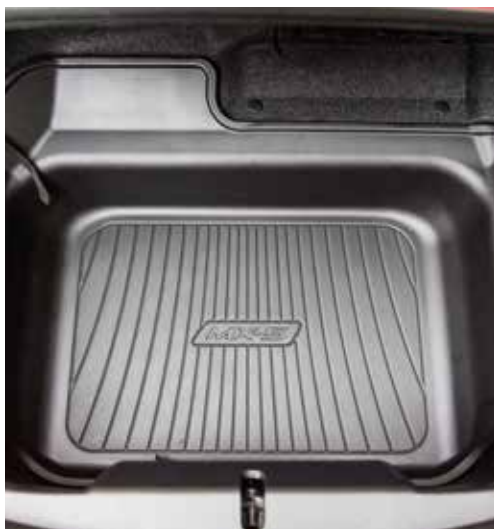
Protection de coffre