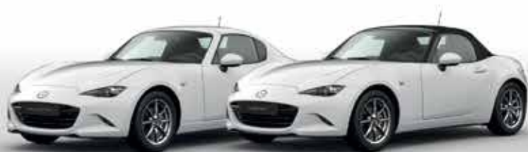
ARCTIC WHITE (A4D)