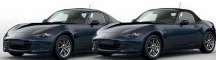
DEEP CRYSTAL BLUE (42M)*