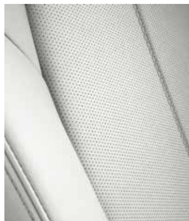
Sellerie en cuir Nappa blanc avec surpiqûres contrastantes (KIZUNA)