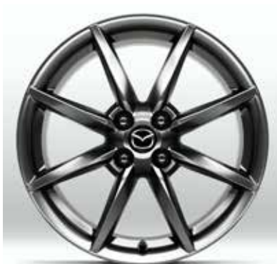
Jantes en alliage 'Bright Dark' 17" pour pneus 205/45 R17 sur EXCLUSIVE-LINE, KAZARI & KIZUNA (uniquement sur Skyactiv-G 184 ch)