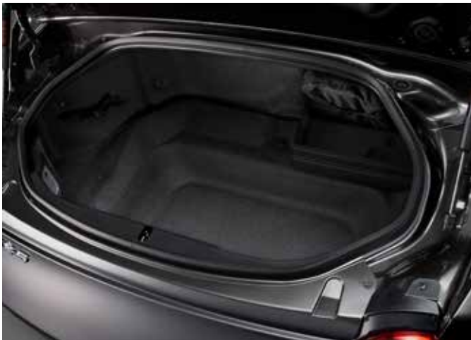
Coffre de la Mazda MX-5 RF