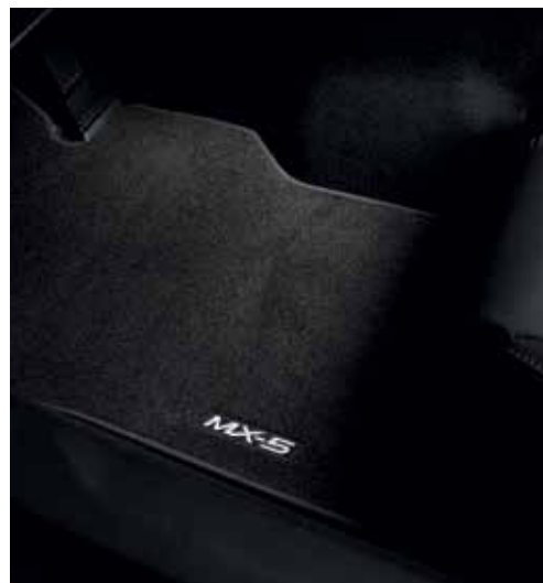
Tapis de sol « Standard »