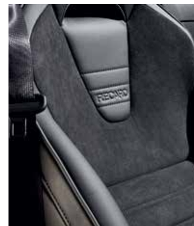
Sièges Recaro® avec revêtement en cuir noir et Alcantara® noir, surpiqûres 'Silver' et passepoil gris* (HOMURA)