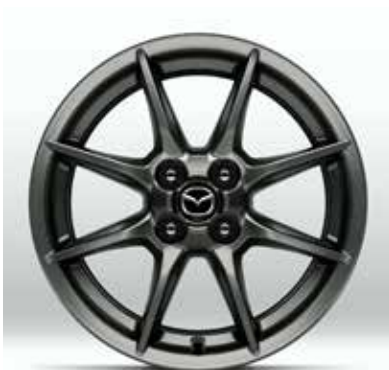
Jantes en alliage 'Bright Dark' 16" pour pneus 195/50 R16 sur EXCLUSIVE-LINE, KAZARI & KIZUNA (uniquement sur Skyactiv-G 132 ch)