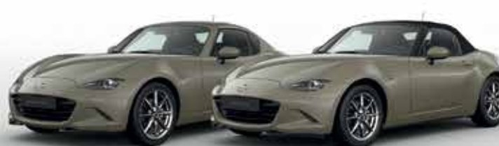
ZIRCON SAND (48T)*