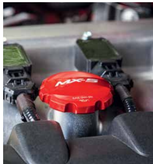
Bouchon de remplissage d'huile (rouge)