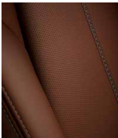
Sellerie en cuir Nappa 'Terracotta' avec surpiqûres 'Silver' (KAZARI)