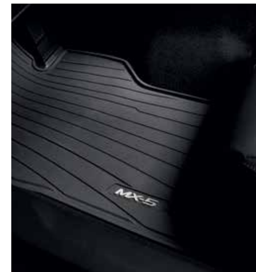
Tapis de sol « Caoutchouc »