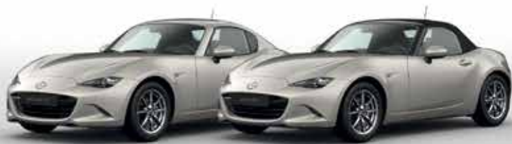
PLATINUM QUARTZ (47S)*