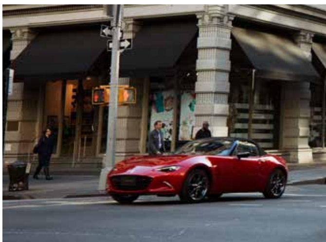
Mazda MX-5 Roadster Homura