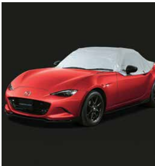
Demi-housse de protection de voiture extérieure (uniquement sur Roadster)