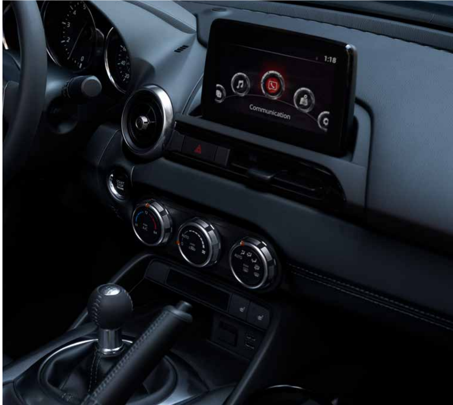
Climatisation automatique, sièges chauffants à l'avant, HMI Commander et MZD Connect avec écran couleur tactile 7"