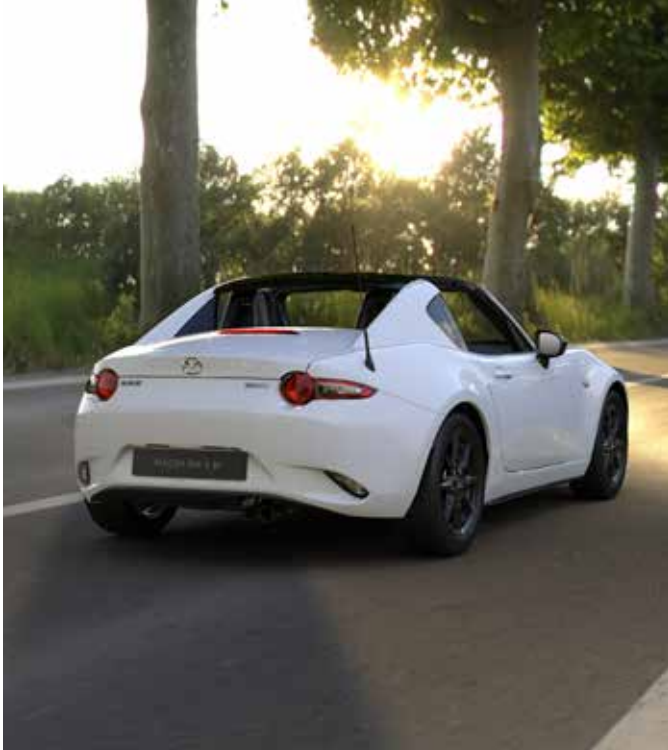
Toit rétractable automatique avec isolation et ciel de toit noir (uniquement sur RF)