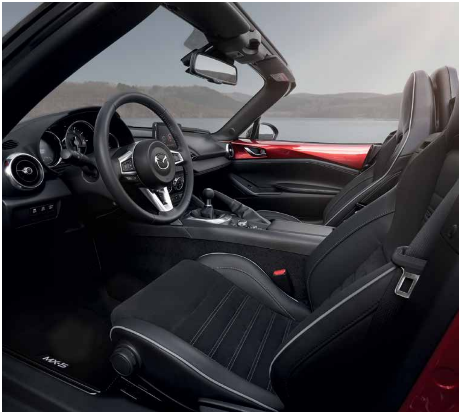
Sièges Recaro® avec revêtement en cuir noir et Alcantara® noir, surpiqûres 'Silver' et passepoil gris *