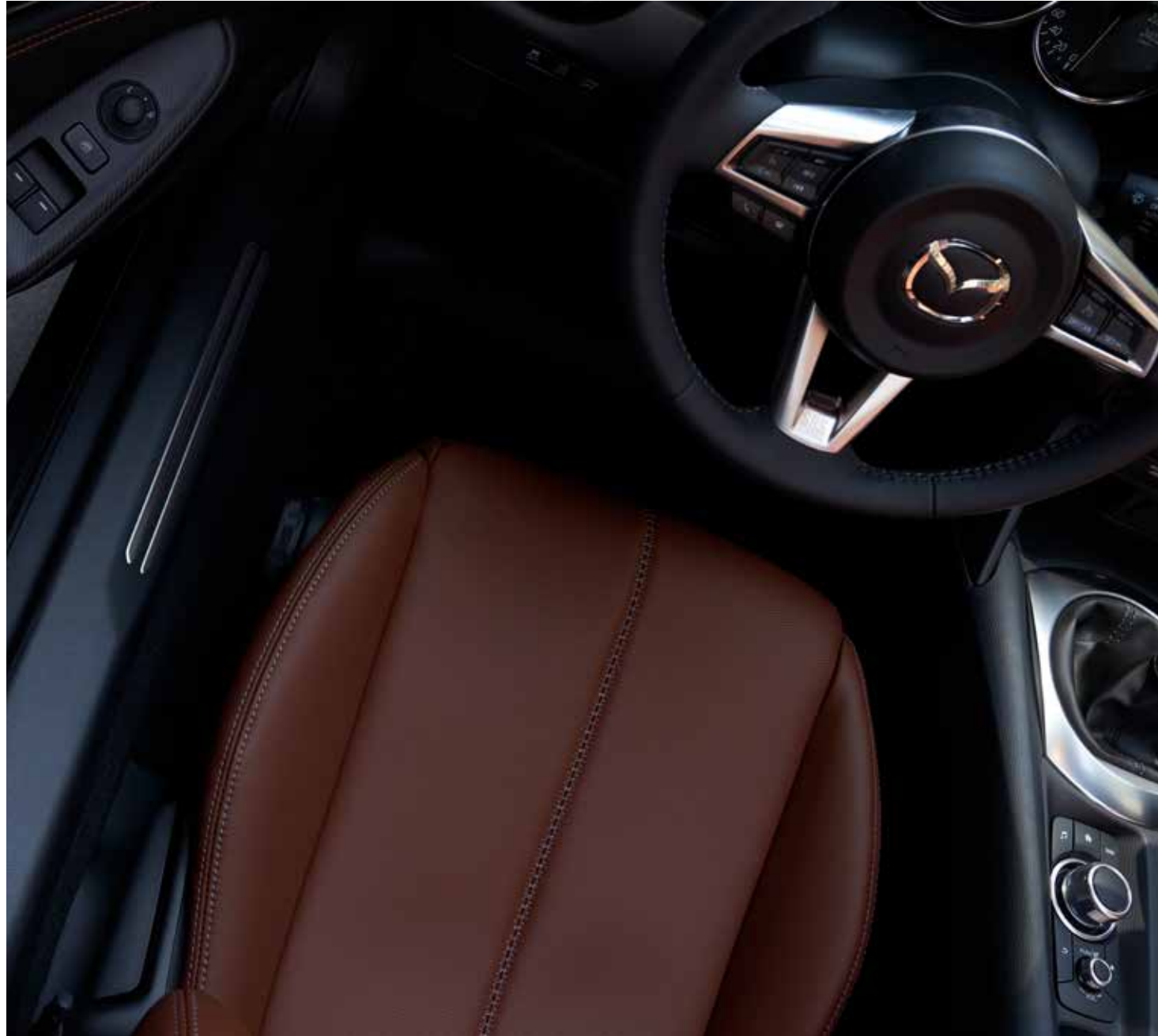
Sellerie en cuir Nappa 'Terracotta' avec surpiqûres 'Silver' et revêtement du tableau de bord en similicuir noir avec surpiqûres 'Terracotta'