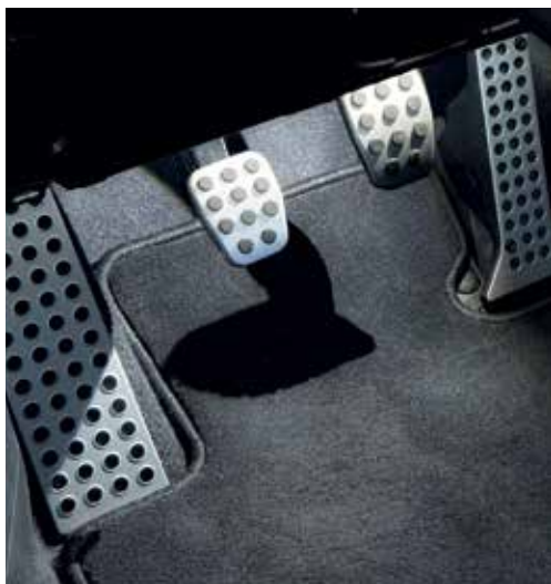
Éclairage d'embarquement (LED)