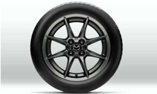
Jantes en alliage 'Bright Dark' 16" avec pneus 195/50 R16 (uniquement sur SKYACTIV-G 132 ch)