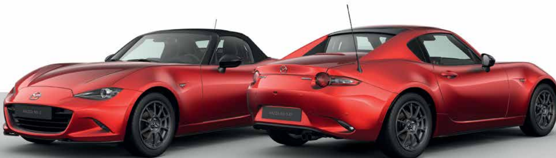
Modèle illustré : Mazda MX-5 Homura SKYACTIV-G 132 ch