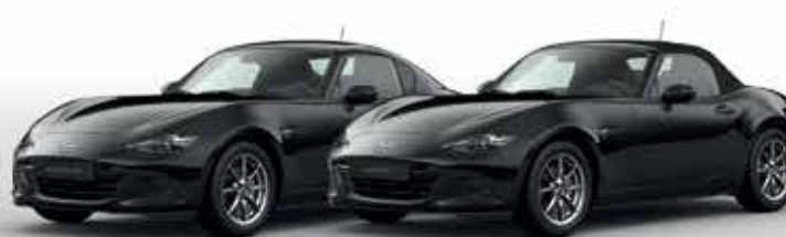
JET BLACK (41W)*