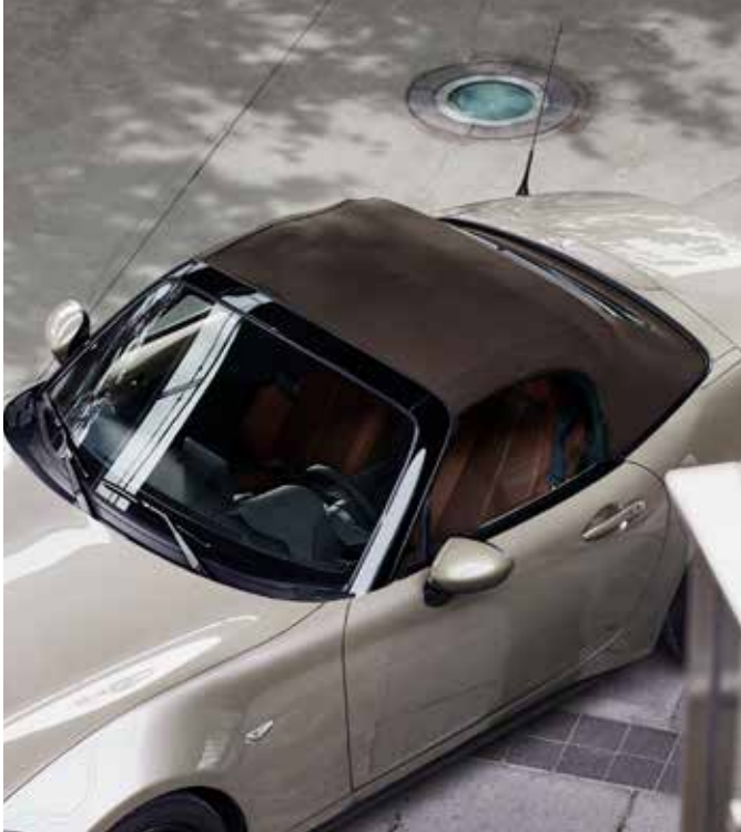
Capote brune souple avec isolation à ouverture manuelle (uniquement sur Roadster)