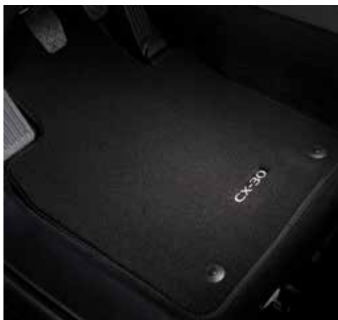
TAPIS DE SOL « STANDARD » € 90