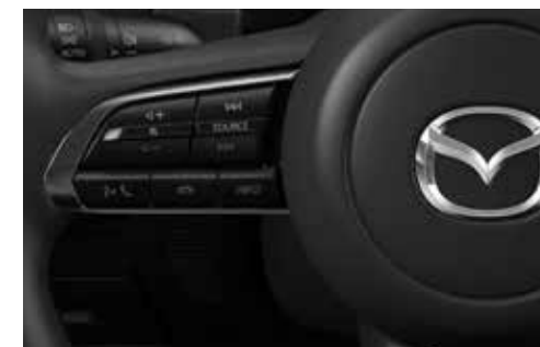
Commandes au volant (audio et Bluetooth)