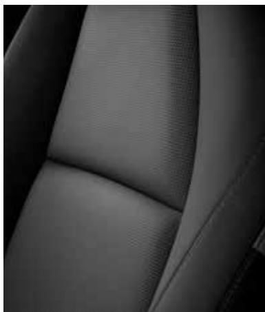
REVÊTEMENT DES SIÈGES EN TISSU NOIR (PRIME-LINE, CENTER-LINE & EXCLUSIVE-LINE)