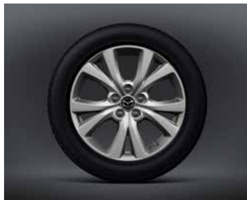
JANTES EN ALLIAGE 18" 'SILVER' AVEC PNEUS 215/55R18 (CENTER-LINE & EXCLUSIVE-LINE)