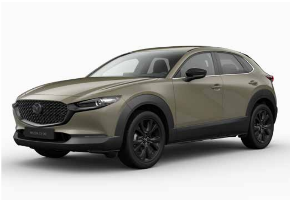
Modèle illustré: la Mazda CX-30 en teinte optionnelle Zircon Sand