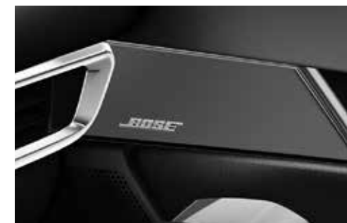
Système audio Bose®