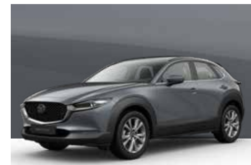
POLYMETAL GREY | € 600