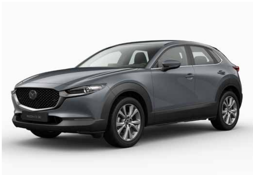
Modèle illustré: la Mazda CX-30 e-SKYACTIV X en teinte optionnelle Polymetal Grey