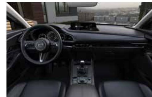
Revêtement des sièges en cuir noir avec surpiqûres contrastantes