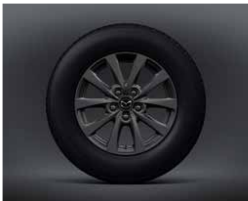
JANTES EN ALLIAGE 16" 'GREY' AVEC PNEUS 215/65R116 (PRIME-LINE)