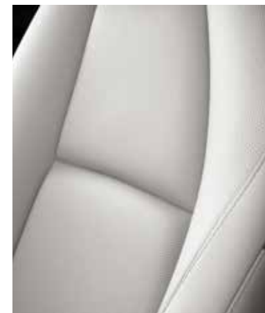
REVÊTEMENT DES SIÈGES EN CUIR BLANC AVEC SURPIQÛRES CONTRASTANTES (TAKUMI) (EN OPTION, UNIQUEMENT SUR E-SKYACTIV X)