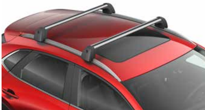
BARRES DE TOIT POUR RAILS DE TOIT € 520