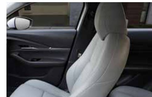
Revêtement des sièges en cuir blanc avec surpiqûres contrastantes (sur e-SKYACTIV X uniquement)