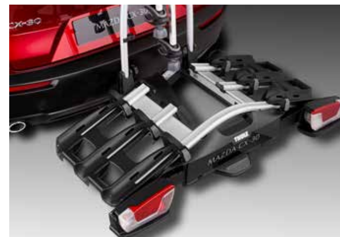
PORTE-VÉLOS THULE COACH 276 (3 VÉLOS) € 690