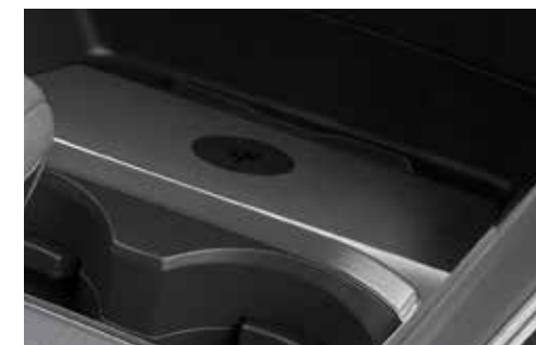
Chargeur sans fil Qi