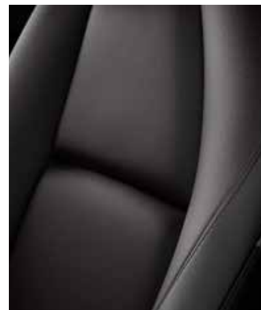
REVÊTEMENT DES SIÈGES EN CUIR NOIR AVEC SURPIQÛRES CONTRASTANTES (TAKUMI)