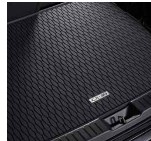
PROTECTION DE COFFRE € 120