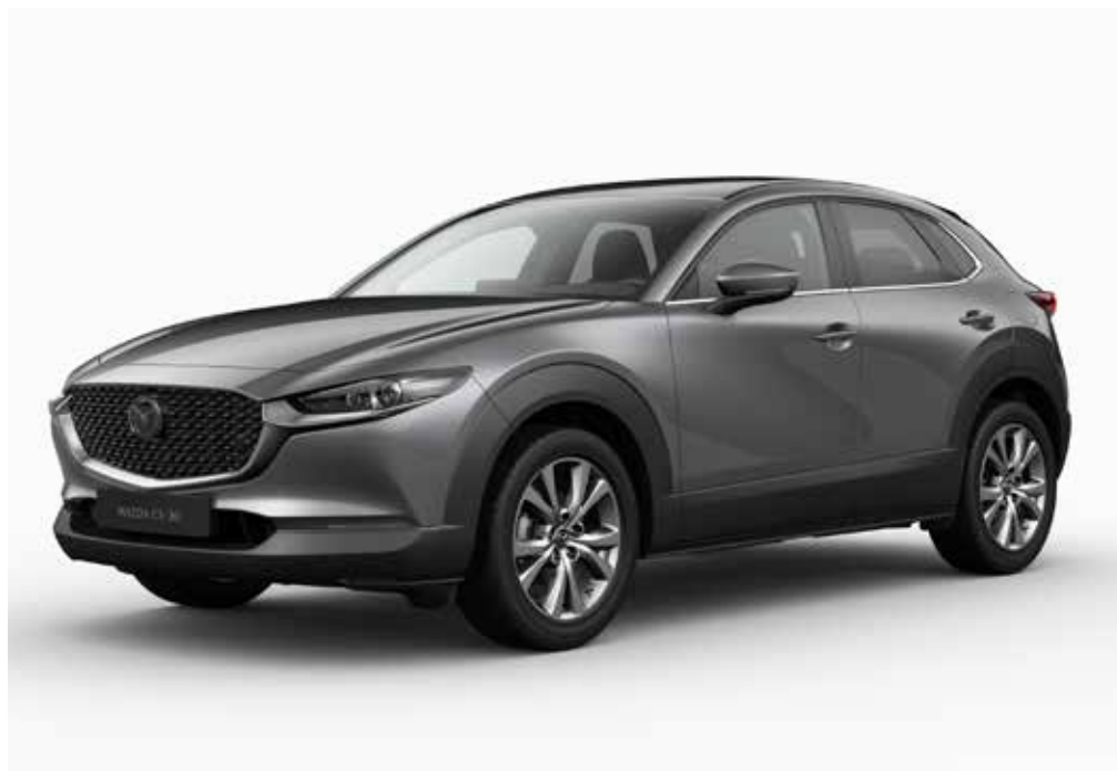
Modèle illustré: la Mazda CX-30 e-SKYACTIV X en teinte optionnelle Machine Grey