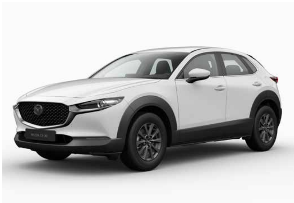
Modèle illustré: la Mazda CX-30 en teinte Arctic White