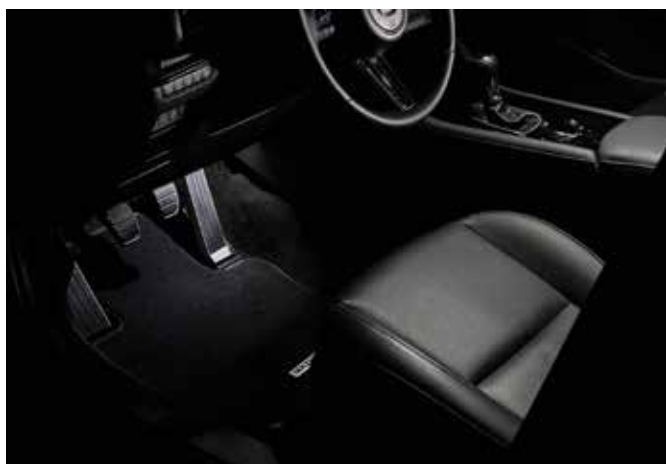
ÉCLAIRAGE D'EMBARQUEMENT (LED) € 200