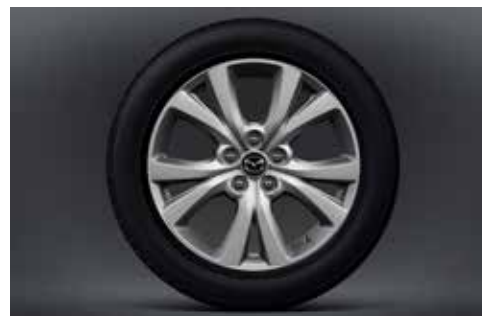
Jantes en alliage 18" 'Silver' avec pneus 215/55R18