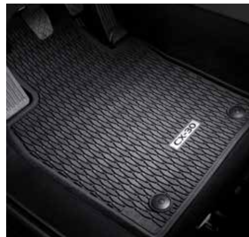
TAPIS DE SOL « CAOUTCHOUC » € 130