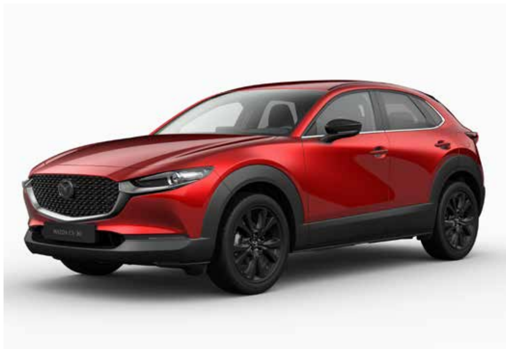
Modèle illustré: la Mazda CX-30 en teinte optionnelle Soul Red Crystal