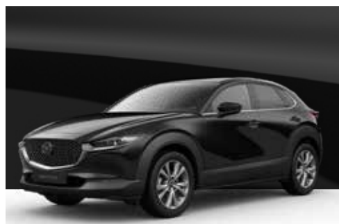
JET BLACK | € 600

Utilisez notre configurateur pour trouver la Mazda CX-30 qui vous convient parfaitement.