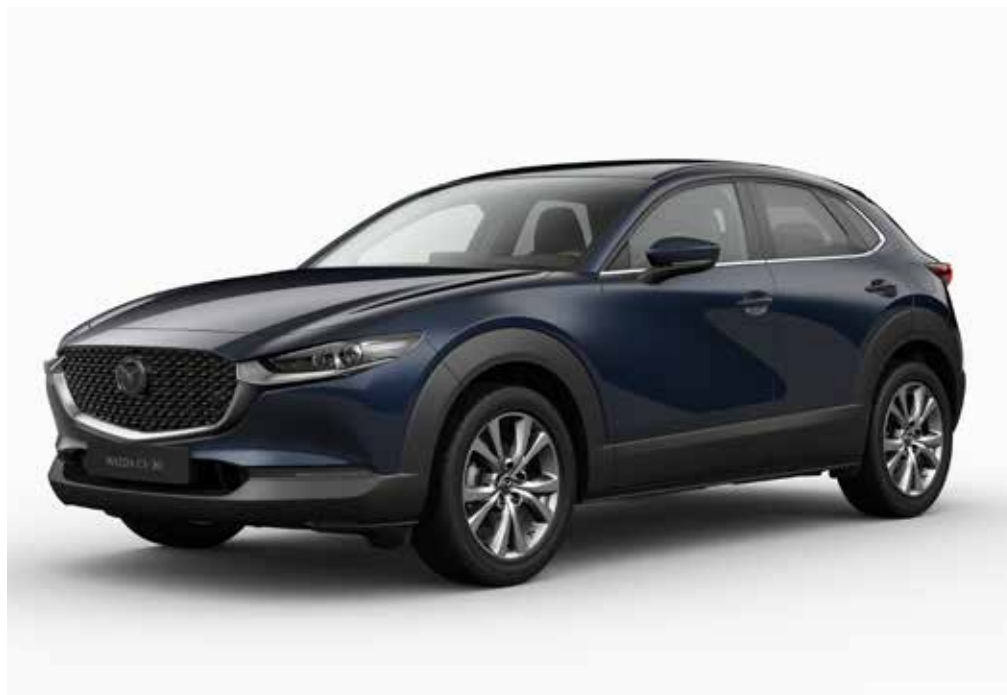
Modèle illustré: la Mazda CX-30 e-SKYACTIV X en teinte optionnelle Deep Crystal Blue