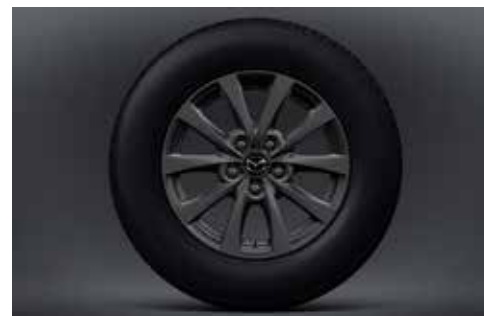
Jantes en alliage 16" 'Grey' avec pneus 215/65R16