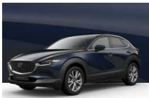
DEEP CRYSTAL BLUE | € 600