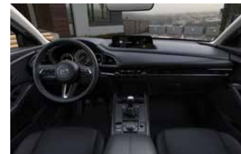
Revêtement des sièges en tissu noir avec surpiqûres de couleur rouge