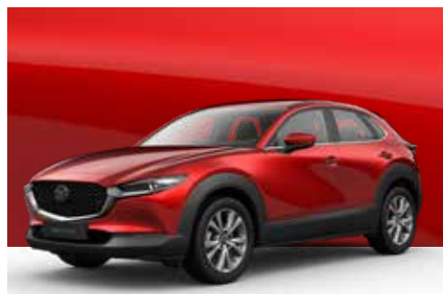
SOUL RED CRYSTAL | € 900