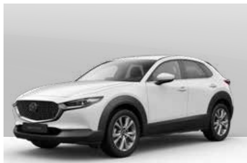
ARCTIC WHITE | € 0