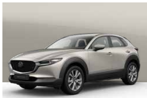
PLATINUM QUARTZ | € 600