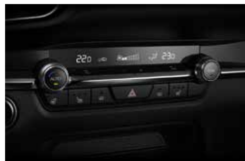
Climatisation automatique bi-zone