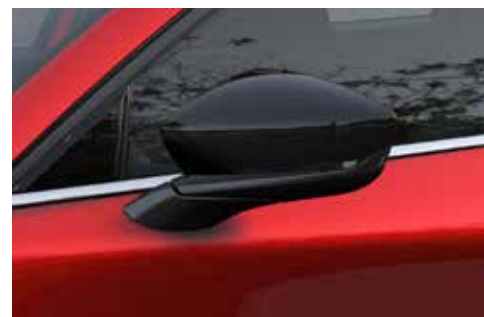
Rétroviseurs extérieurs 'Piano Black'