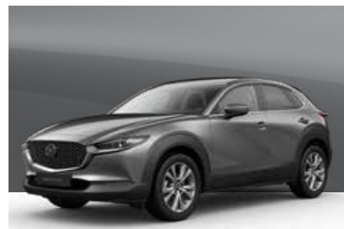
MACHINE GREY | € 800