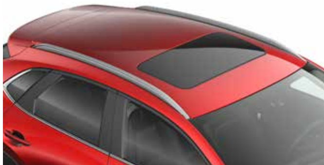
RAILS DE TOIT (ARGENT OU NOIR) € 520