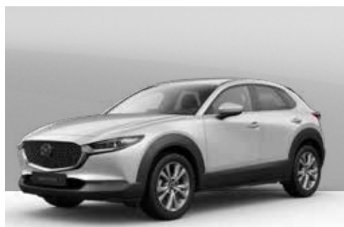
CERAMIC WHITE | € 600