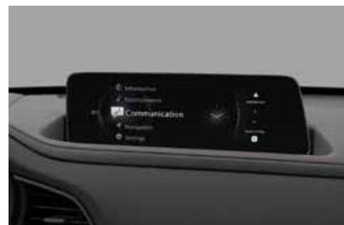
Écran tactile 10,25" TFT