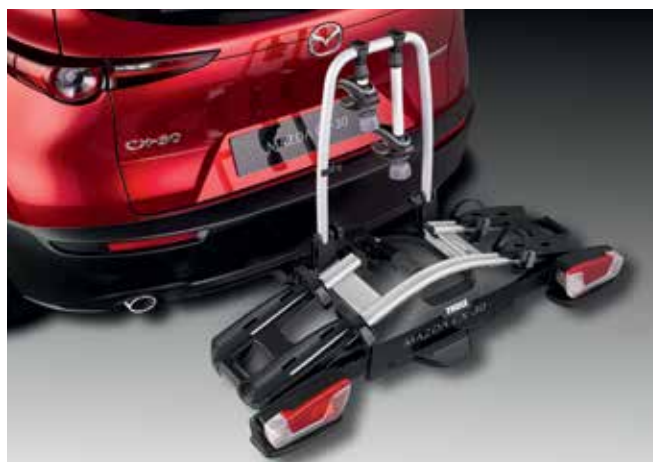
PORTE-VÉLOS THULE COACH 274 (2 VÉLOS) € 590