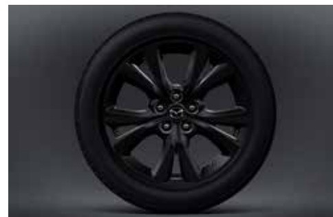
Jantes en alliage 18" 'Black' avec pneus 215/55R18