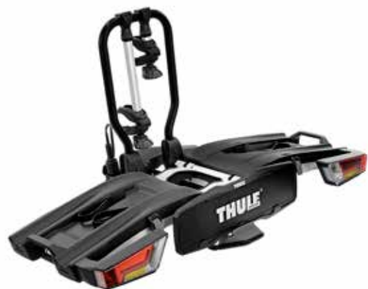
PORTE-VÉLOS THULE EASYFOLD XT 2 (PLIABLE) € 820