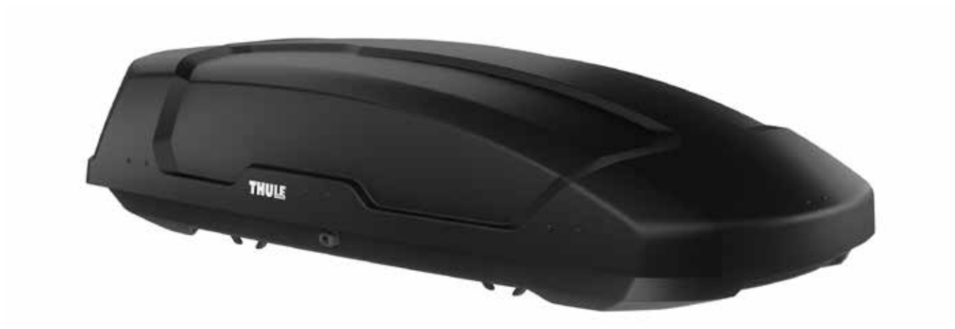
COFFRE DE TOIT (THULE FORCE XT L) € 650