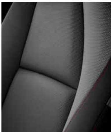
REVÊTEMENT DES SIÈGES EN TISSU AVEC SURPIQÛRES ROUGES (HOMURA)