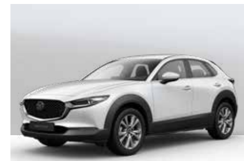
SNOWFLAKE WHITE | € 600