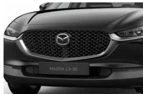
Calandre avant "Piano Black"