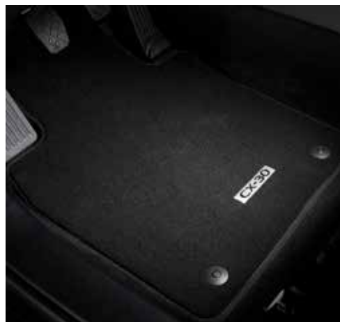
TAPIS DE SOL « LUXE » € 130