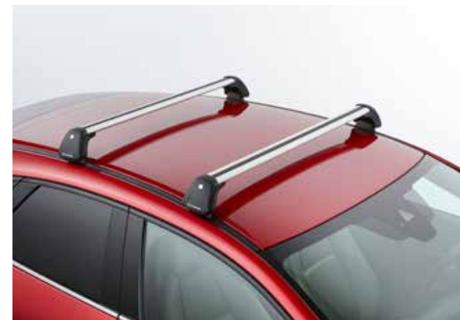
BARRES DE TOIT € 350