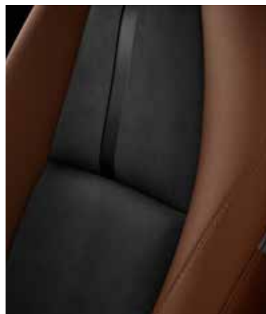
REVÊTEMENT DES SIÈGES EN SIMILICUIR 'TERRACOTTA' / LEGANU® SUÈDE NOIR AVEC SURPIQÛRES 'TERRACOTTA' (NAGISA)