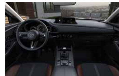
Revêtement des sièges en similicuir 'Terracotta' / Leganu® Suède noir avec surpiqûres 'Terracotta'