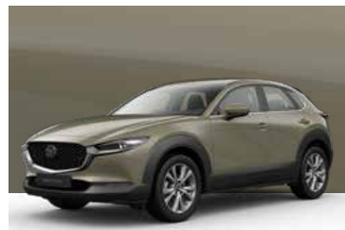
ZIRCON SAND | € 600