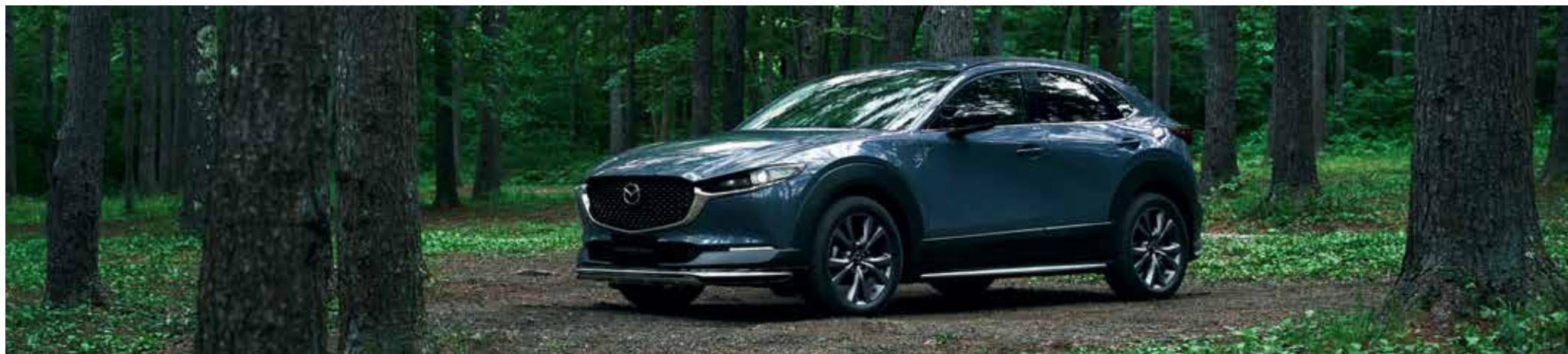
SILVER LININGS PACK