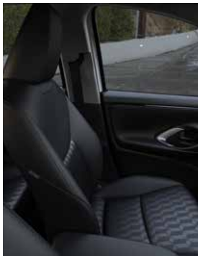
Sièges en tissu premium noir (AGILE)