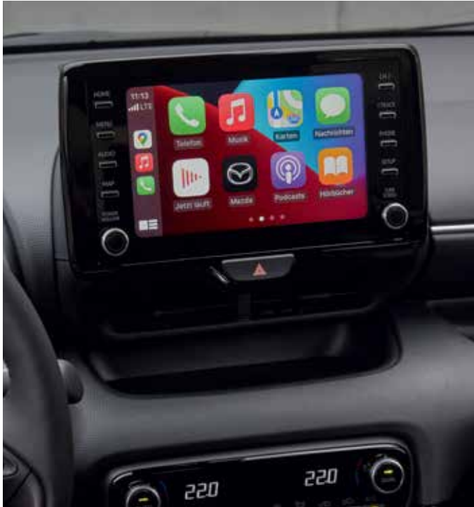
Écran tactile en couleur 8" et Apple CarPlay™