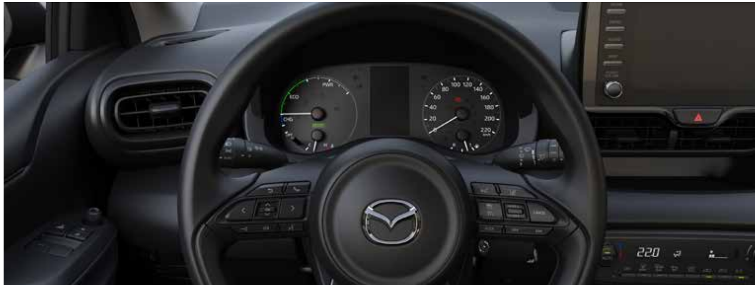
Tableau d'instrumentation analogique