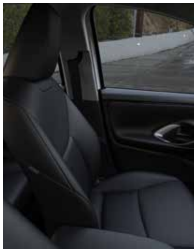
Sièges en tissu noir (PURE)