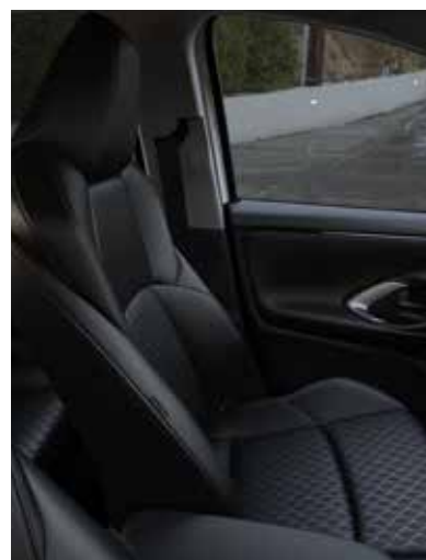
Sièges avant sport avec revêtement en tissu/similicuir noir (SELECT)