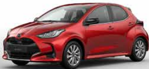
FORMAL RED (A9V)*