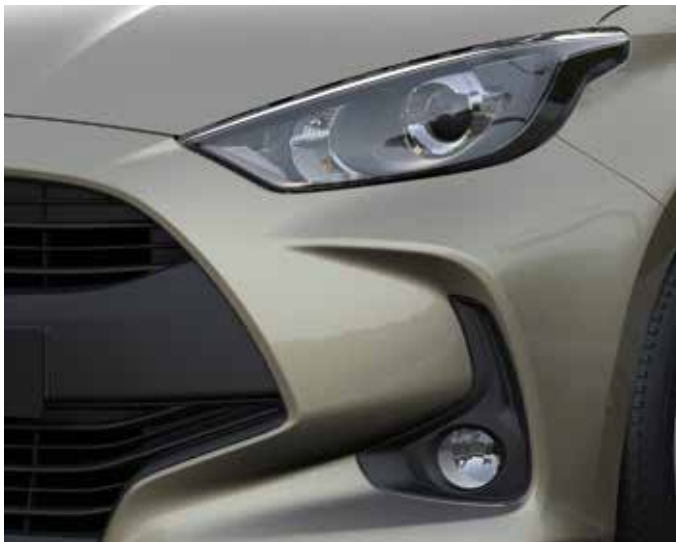
Phares antibrouillard halogènes