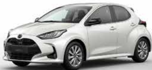
NORTHERN WHITE PEARL (48D)*