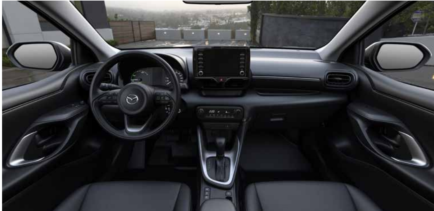
Revêtements des sièges en tissu noir, des panneaux de portes en tissu et système multimédia avec écran tactile en couleur 7"