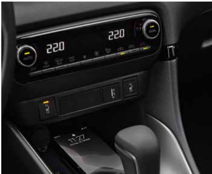
Climatisation automatique bi-zone et chargeur sans fil sur la console centrale