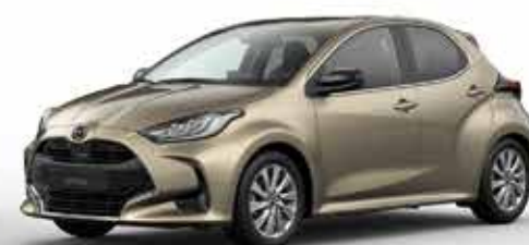
MONUMENT BRONZE (48H)*