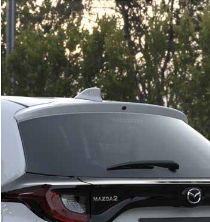
Antenne type requin