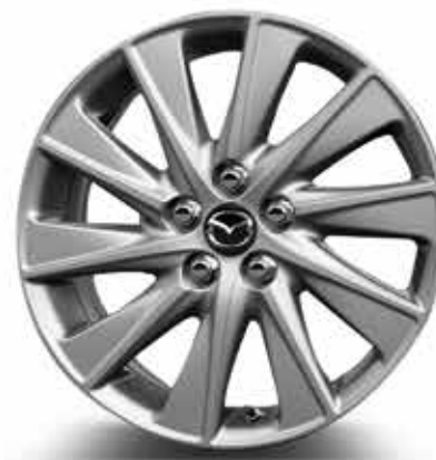
Jantes en alliage 16" pour pneus 195/55 R16 (SELECT)