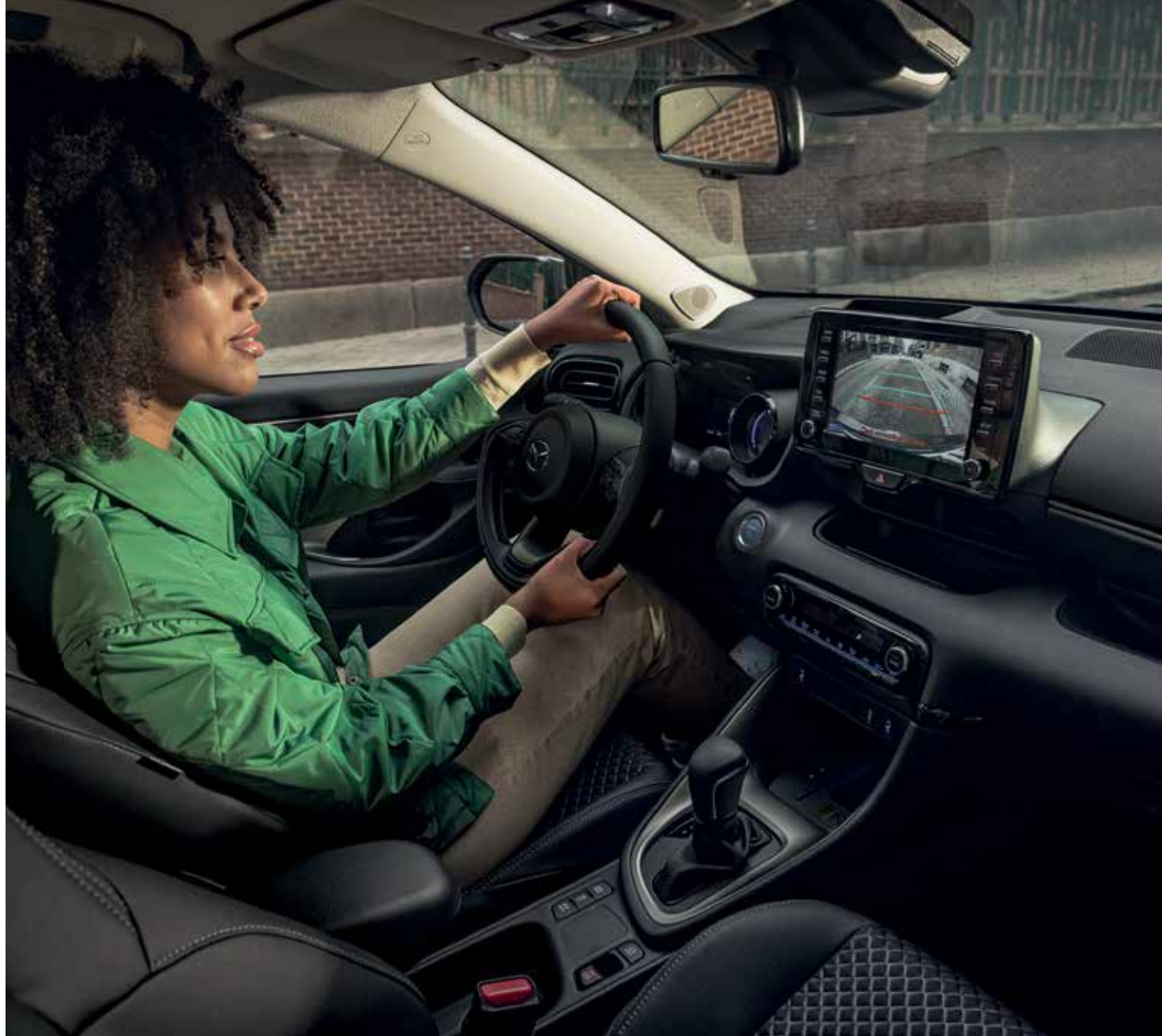
Sièges avant sport avec revêtement en tissu/similicuir noir