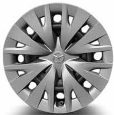
Jantes en acier 15" avec enjoliveur pour pneus 185/65 R15 (PURE)