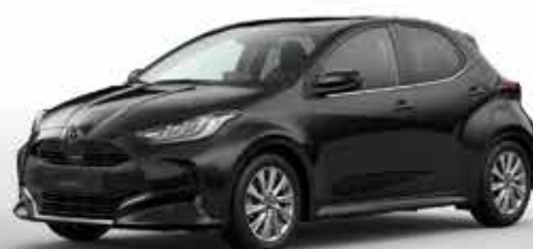
OPERA BLACK (49W)*