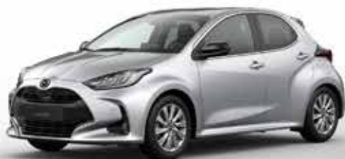
STORMY SILVER (49S)*