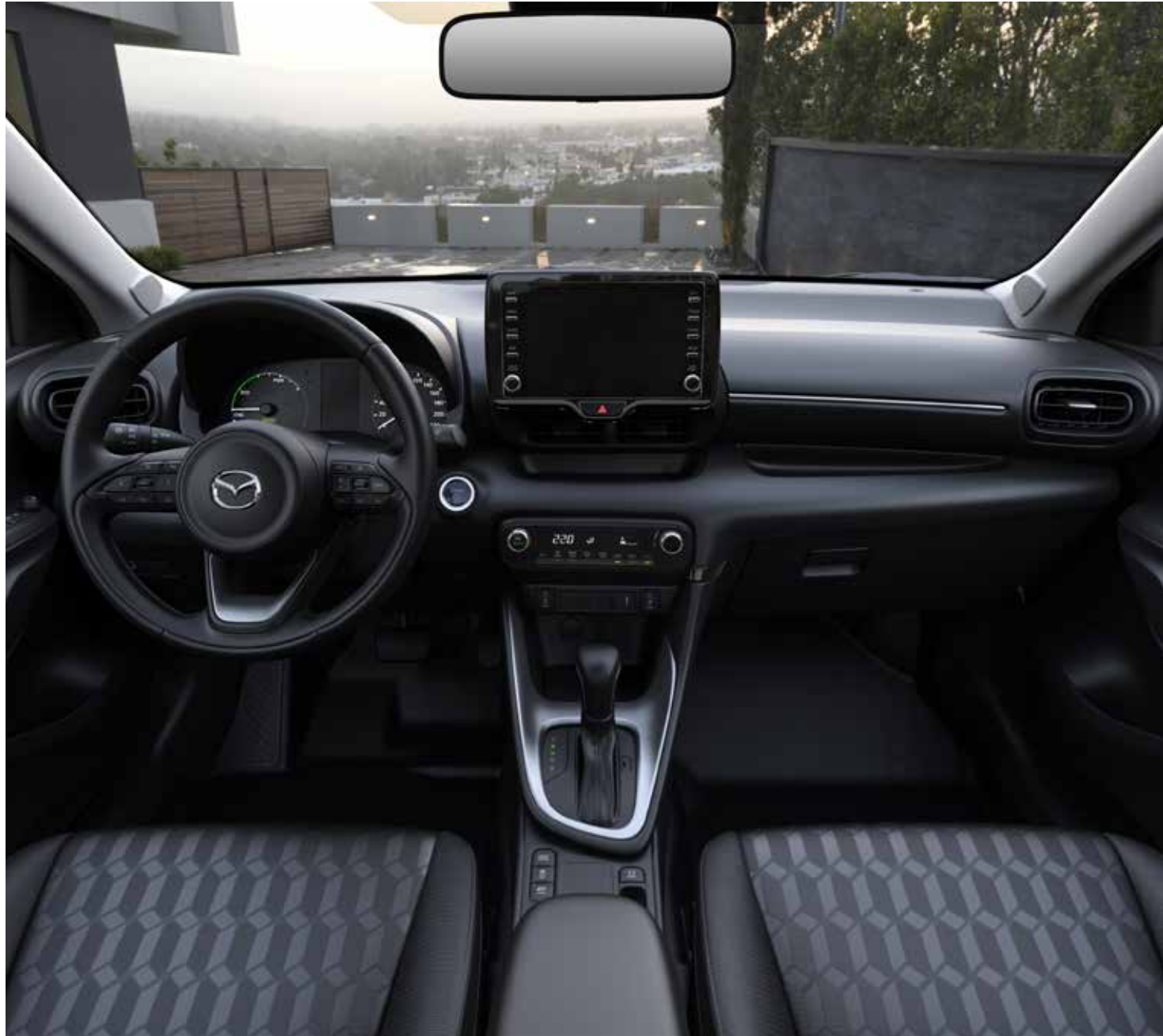
Revêtement des sièges en tissu premium noir, volant et pommeau du levier de vitesse gainés cuir