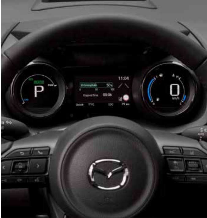
Tableau d'instrumentation digital