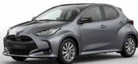
LEAD GREY (48G)*