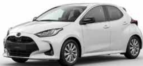
LUNAR WHITE (A8D)